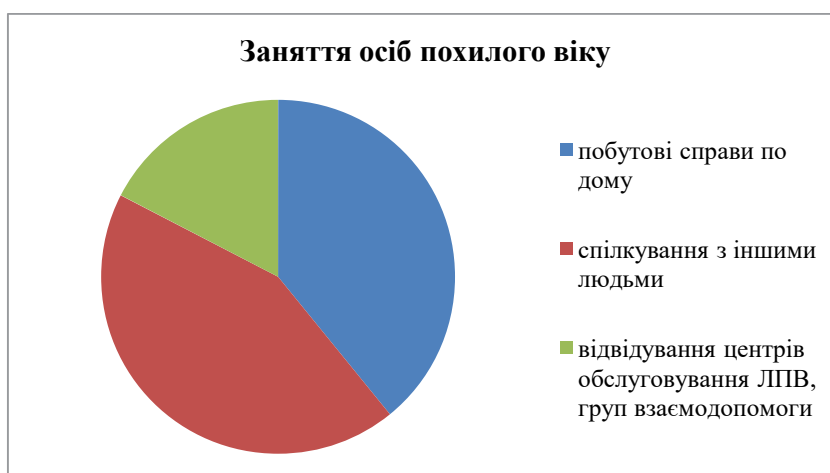
Рис. 3. Провідні заняття осіб поважного віку

на ситуацію коли в таких умовах обмежать коло безпосереднього спілкування і перейдуть на онлайн спілкування чи на телефонне. 5% опитаних вважають, що маючи медичну освіту зможуть допомогти у профілактиці поширення вірусу, а ще 20% уникнули відповіді.