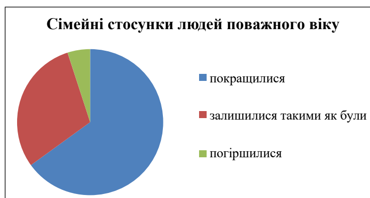
Рис. 4. Сімейні стосунки людей поважного віку