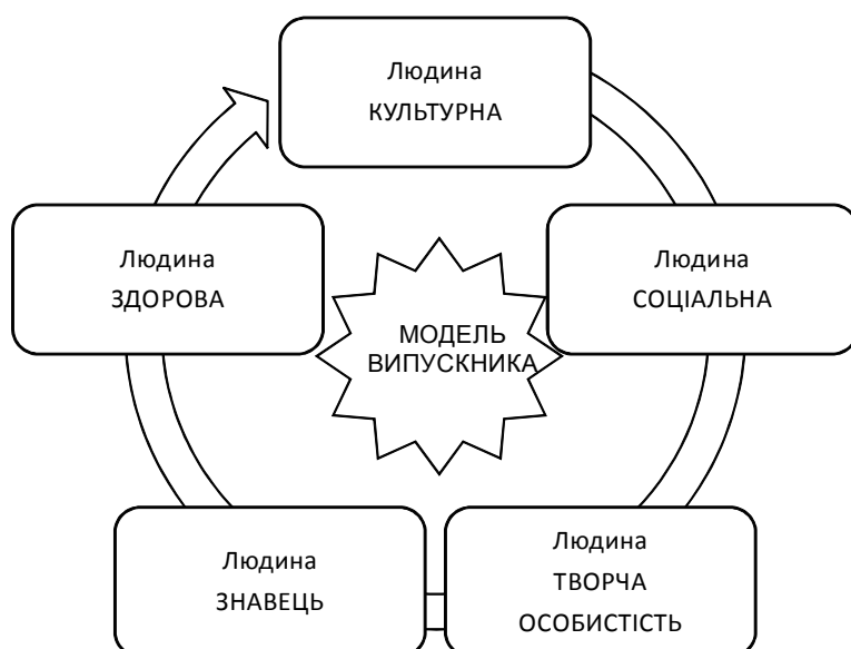
Рис. 3. Модель випускника Розсошенської гімназії