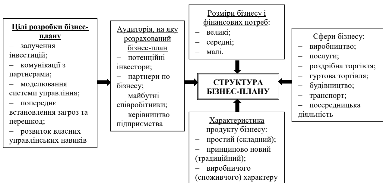
Рис. 1. Фактори впливу на зміст та структуру бізнес-плану підприємства, що реалізує стратегію конкурентоспроможності на внутрішньому ринку

завдань у забезпеченні власної конкурентоспроможності. Так, вдається пристосуватись до ринкових трансформаційних перетворень в системі ведення бізнесу, що супроводжуються зміною економічного середовища підприємства, формуванням нових методів використання ресурсного потенціалу. Тим самим, система змін формує конкурентне середовище підприємства, як сферу якісного планування процесів переходу з одного конкурентного стану в інший. При цьому бізнес-моделювання системи забезпечення конкурентоспроможності підтверджує успіх удосконалення господарсько-фінансового механізму підприємства чи започаткування нових перспективних напрямів діяльності. Саме значна кількість управлінських зв'язків, які утворюють економічні комунікації, призводить до необхідності узгодження усієї системи ведення бізнесу та збалансованості конкурентного середовища функціонування підприємств.