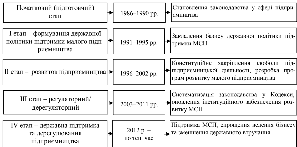
Рис. 1. Періодизація розвитку законодавчого забезпечення підприємництва в Україні

Виклад основного матеріалу. Періодизацію розвитку законодавчого забезпечення підприємництва в Україні представлено на рис. 1.