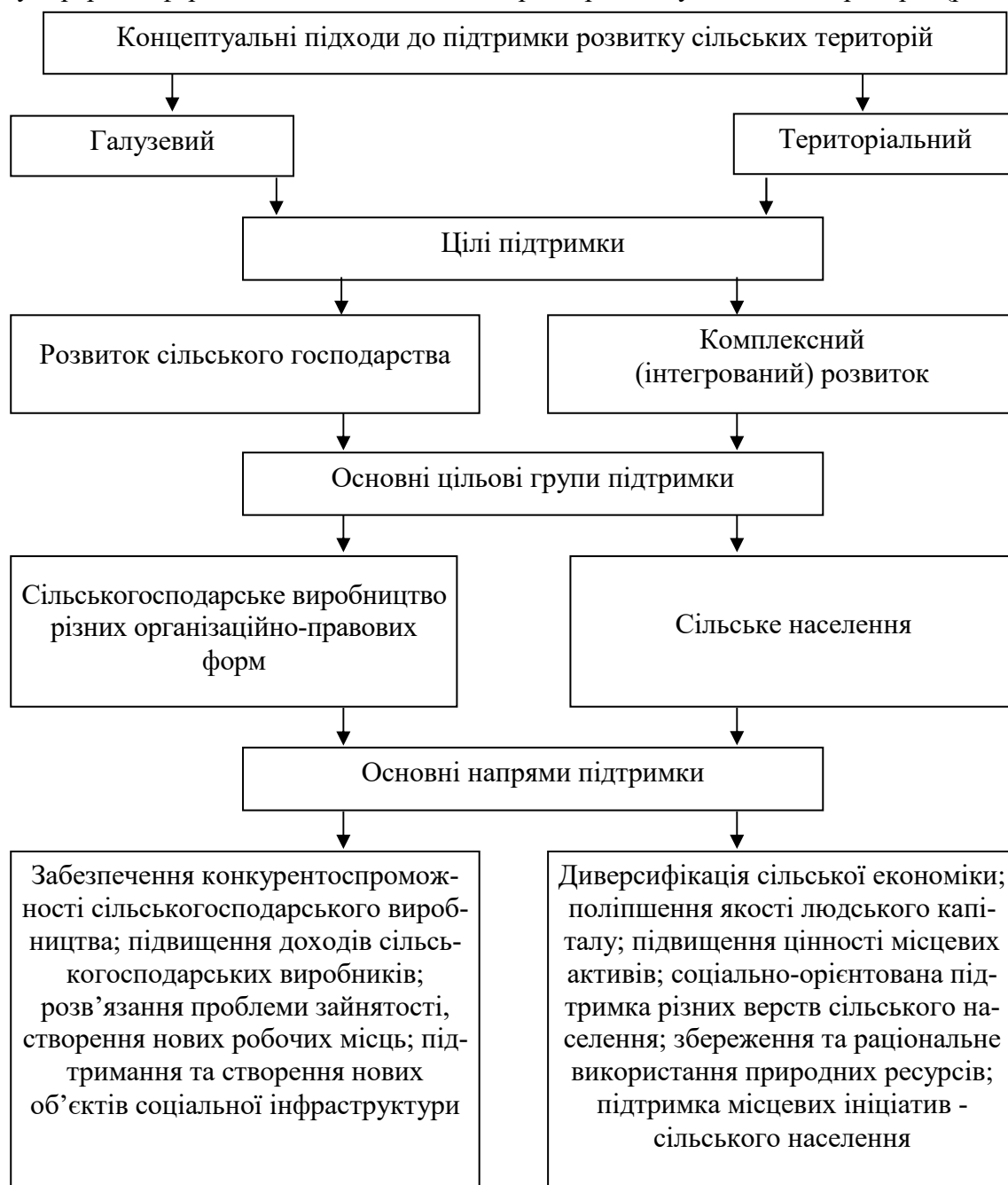
Рис. 2. Напрями розвитку сільських територій

Узагальнення напрацювань українських і закордонних учених, практичних результатів у аграрній сфері дозволило визначити напрями розвитку сільських територій (рис. 2).