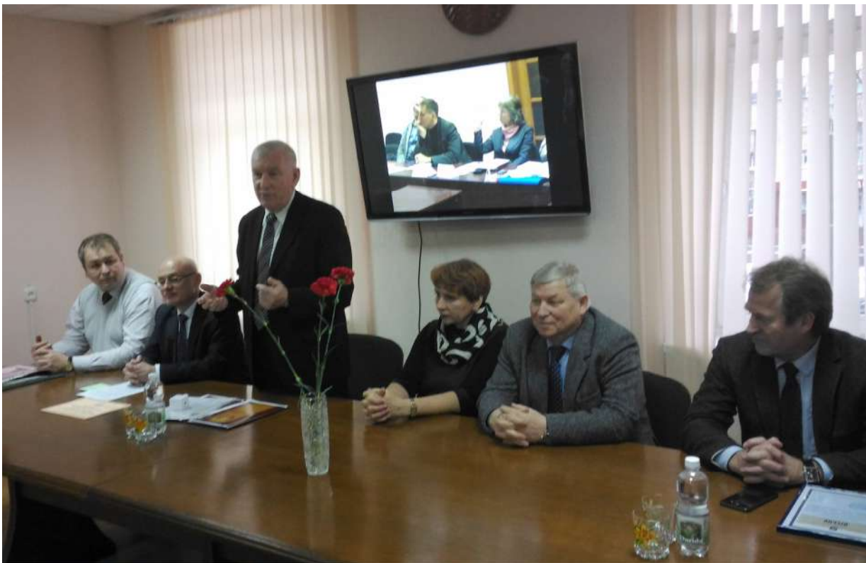
Вітальне слово директора Департаменту з архівів та діловодства Міністерства юстиції Республіки Білорусь В. І. Адамушка

З вітальним словом до учасників круглого столу звернувся проректор із навчальної роботи Білоруського державного університету С. М. Ходін, який у своєму виступі акцентував увагу на співробітництво науки і освіти, актуальних питаннях підготовки професійних кадрів архівістів та документознавців.