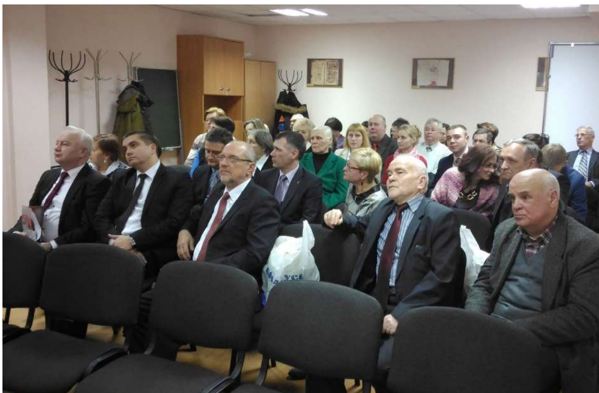
Учасники круглого столу