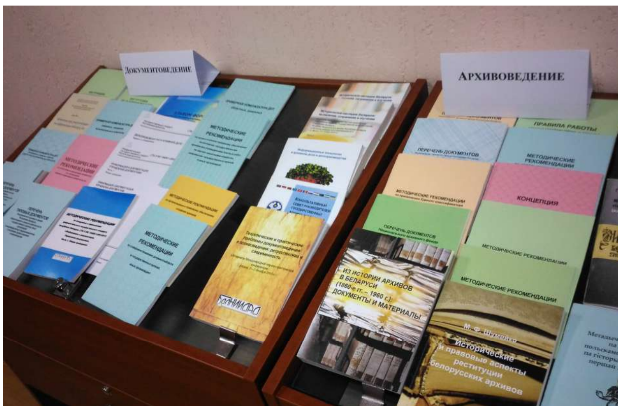
Видання БілНДІДАС за останні п'ять років