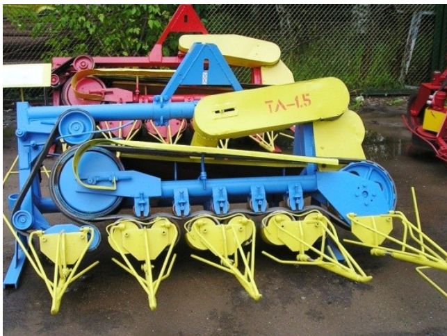
Рис. 2 – Льонобралка ТЛ-1,5, оснащена бральним апаратом з чотирма бральними рівчаками

«Зрілість» ТС. У виробництво в останні десятиліття впроваджені розроблені конструкторами Білорусі і Росії льонобралки ТЛ-1,9; ТЛ-1,5 (Росія); ТЛН-3,8 (Білорусь), представлені на рис. 2, 3.