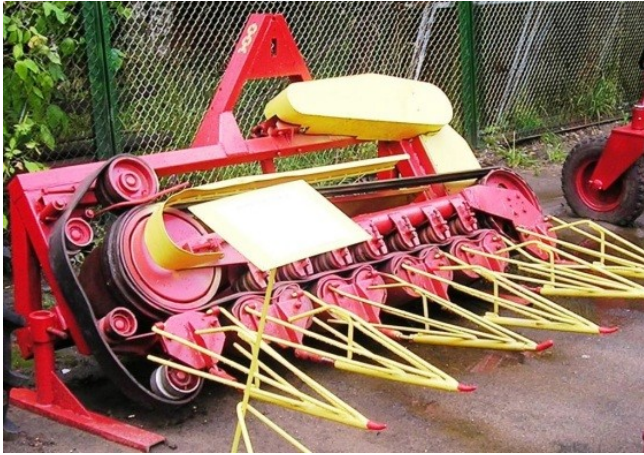
Рис. 3 – Льонобралка ТЛН-3,8 оснащена бральним апаратом з п'ятьма бральними рівчаками

На полях Франції, Бельгії, Нідерландів широко застосовують самохідні льонобралки з одинарними або здвоєними стрічково-дисковими бральними апаратами. Це льонобралки TLZ–120, U/22, U/20, Dei, APA та ін. Зокрема, U/22 фірми «Union» здійснює брання льону з розстилом в дві стрічки. Апарат має два зубчастих паси, два столи розкладання з варіюванням перекосу. Ширина захвату 2×1,14 м. Паси брання із гідростатичним приводом. Виробництво льонозбиральної техніки налагоджено в Бельгії (фірми Deportere, Klase, Union, Leterm, Kerec); у Франції – Riveere-Casalis, Deon; в Нідерландах – Bart.