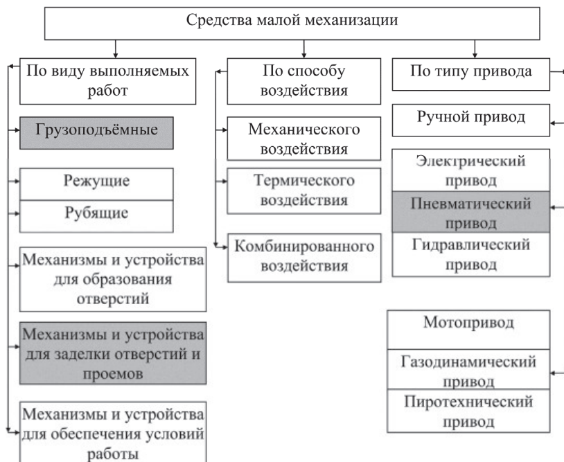
Рис. 3. Классификация средств малой механизации

устройства, назначения, тактико-технических характеристик и сообразно оперативной обстановке в зоне экстремальной ситуации (рис. 3).