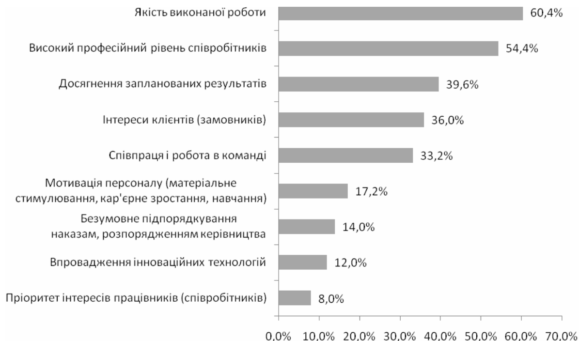
Рис. 2. Структура організаційних цінностей в установах і підприємствах комерційного сектору суспільства

На рис. 2 подано структуру деяких організаційних цінностей у комерційних установах і підприємствах.