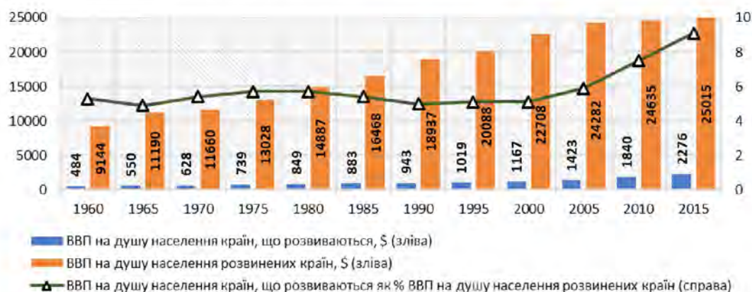
Рис. 4. Темпи зростання реального ВВП на душу населення*