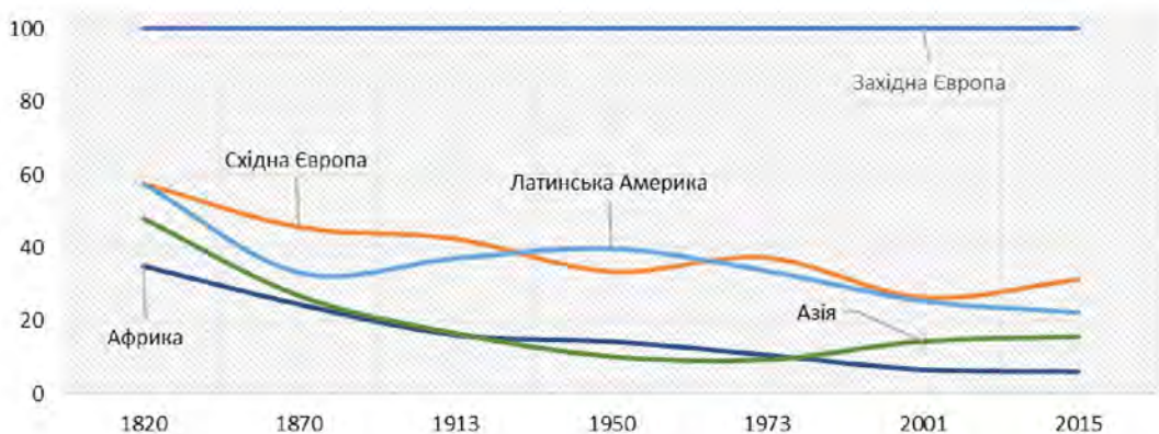
Рис. 5. Дивергенція за ВВП на душу населення

Станом на початок 2017 р. передумови економічного зростання країн, що розвиваються, залишаються досить диверсифікованими. Так, за допомогою тривалого політичного стимулу темпи зростання в Китаї були сильнішими, ніж очікувалося. Проте дещо слабшою була очікувана економічна активність в деяких латиноамериканських країнах, що переживають рецесію (наприклад, в Аргентині й Бразилії), а також в Туреччині, що було спричинено різким скороченням доходів від туризму. Дещо кращою, ніж очікувалось, була ситуація в сировинних економіках, зокрема в Росії, чому сприяло зміцнення світових цін на нафту [12]. Ці та інші тенденції безпосередньо визначають поточну перспективу розвитку країн, що розвиваються, а загалом задають вектор розвитку світової економіки. Разом із тим, певну вагу мають довгострокові ризики глобального зростання, однак в середньостроковій перспективі вони можуть бути дещо деформовані. Так, останні політичні події знецінюють переваги транскордонної економічної інтеграції. Потенційне розширення глобальних дисбалансів та різкі коливання обмінних курсів у відповідь на певні політичні зміни, ще більше посилюють тиск протекціонізму. Зростаючі обме-