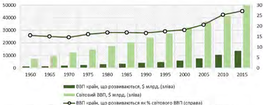
Рис. 1. Економічна динаміка країн, що розвиваються, у 1960-2015 рр.*