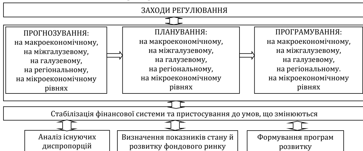
Рис. 2. Організаційна схема визначення місця прогнозування стану фондового ринку країни

основу регуляторних дій можливо створити за допомогою використання лінійних і нелінійних методів і моделей, які у формалізованому вигляді здатні відбивати характер економічних процесів, які мають місце. Отримані результати й сценарії можуть бути використані при складанні програм розвитку національної економіки в цілому та окремих її складових. Процес прогнозування розвитку ринку стає більш актуальним, оскільки роль фондового ринку для економіки країни постійно збільшується. На фондовому ринку України представлені цінні папери, що мають відмінності за видами економічної діяльності та за територією.