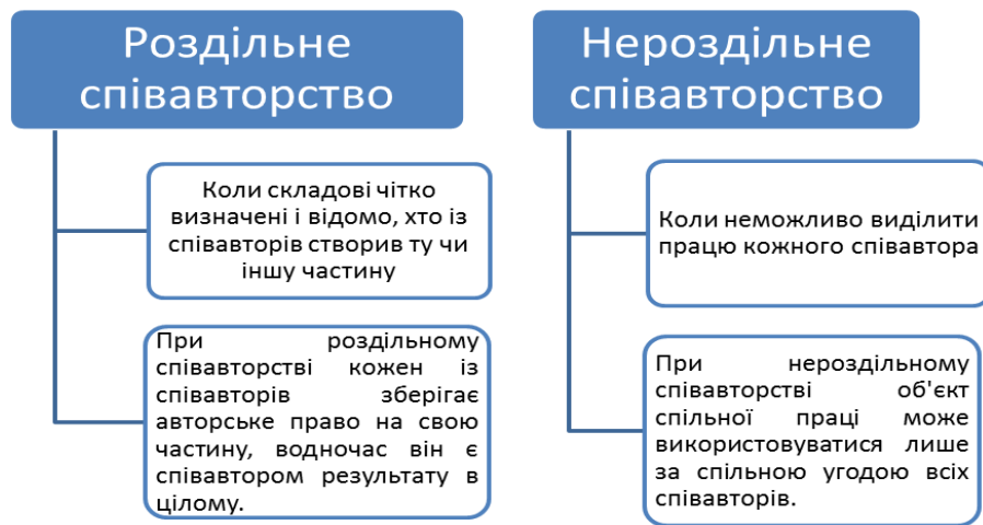
Рис. 2. Два види співавторства: розроблено авторами на основі джерела [4]

Суб'єктами авторського права можуть бути не лише автори, а й роботодавці, коли йдеться про так звані службові результати творчої діяльності, які найчастіше створюються саме у сфері вищої освіти. За певних умов роботодавець визнається суб'єктом права інтелектуальної власності незалежно від волі автора, хоча його не можна визнавати правонаступником, оскільки право інтелектуальної власності не переходить до нього від автора. Взаємовідносини між авторами та роботодавцями під час створення службових творів також вимагають дотримання принципів академічної доброчесності. «Чітко прописані службові обов'язки науково-педагогічних працівників у трудових договорах (контрактах), їх права та обов'язки відносно створення службових творів, а також відповідальність роботодавця (керівництва ЗВО) щодо службових ОПВ можуть стати запобіжником від порушень прав інтелектуальної власності у ЗВО України. Безумовно, науково-педагогічні працівники (автори) теж мають визнавати право ЗВО в особі роботодавця на об'єкти, створені на виконання службового завдання. Особливо, якщо працівник (автор) використовував для створення ОПВ матеріально-технічну базу закладу, будь-які технічні засоби, устаткування, лабораторії, інформацію, тощо. Але й роботодавець (ЗВО) має визнавати права науково-педагогічних працівників, захищати ці права...» [7, с. 63]. До сьогодні в Україні існує правова колізія,