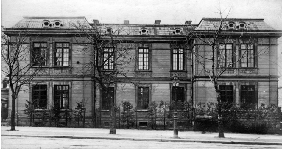
Рис. 19. Дитяча лікарня св. Софії. 1912 р. Архівне фото

Товариство доброчинності дам у Львові було створено у 1816 році з метою підтримки збіднілих родин. Зазвичай таких родин було від 35-ти до 50-ти. Перед I світовою війною підтримку отримували близько 60 родин. Фонди склались із внесків членів товариства та святкових пожертв. У 1854 р. було створено сиротинець для дівчат ім. княгині Гелени Понінської, який розміщувався при закладі св. Терези сестер згромадження Провидіння Божого [27], під опікою яких постійно перебувало близько ста вихованок. Інтернат надавав освіту в обсязі 6-класної школи. Після II світової війни сестри покинули Львів, будівлі були передані Львівській політехніці, у власності якої вони перебувають по сьогодні.