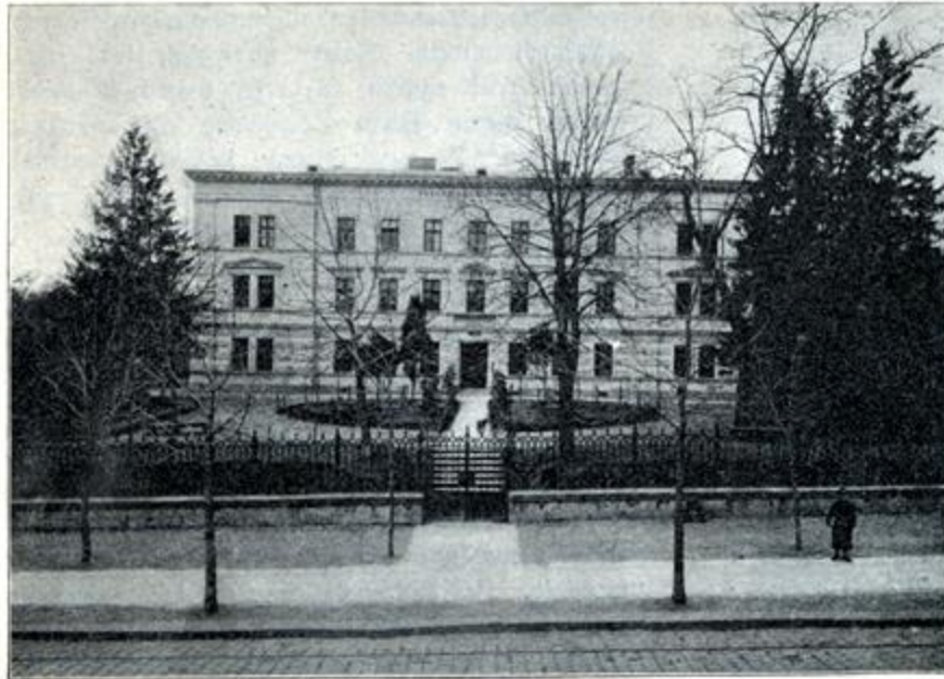
INSTYTUT GŁUCHONIEMÝCH WE LWOWIE.