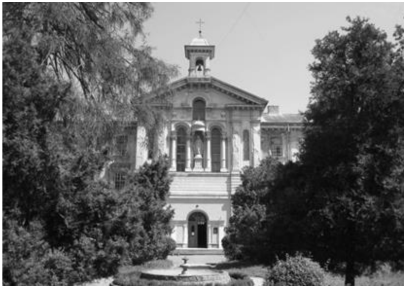
Рис. 13. Львівська обласна психіатрична лікарня. 2014 р.

Особливої уваги заслуговує інформація про першу на Галичині психіатричну лікарню – на Кульпаркові, яку було відкрито у 1875 р. Божевільня, яка функціонувала як окреме відділення Крайового загального шпиталю з часу його відкриття, наприкінці XIX ст. вже не відповідала рівню надання сучасної психіатричної допомоги. Отже, було прийнято рішення про побудову окремого шпиталю на 500 ліжок із врахуванням особливостей лікування даної недуги. Тепер ця установа функціонує як Львівська обласна клінічна психіатрична лікарня [20].