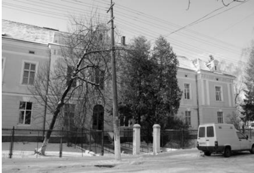
Рис. 11. Будівля загального шпиталю у Самборі. Фото 2013 р.

В Самборі із 1825 р. функціонував міський шпиталь, з 1867 р. визнаний як загальний шпиталь на 116 ліжок. Догляд за пацієнтами здійснювали лікар та сестри милосердя. З 1831 р. у Дрогобичі міським самоврядуванням було закладено шпиталь на 89 ліжок, який до 1890 року розширився до 180 ліжок. Перед I світовою війною у лікарні працювало 3 лікарів доглядали за хворими сестри-служебниці Найсвятішої Панни Марії (NPM). Шпиталь у Бродях, який закладено у 1831 р. як міський, отримав статус загального у 1861 р. У Станіславові з 1841 р. був закладений шпиталь ім. Архикнязя Фердинанда на 120 ліжок, з часом визнаний загальним. У Тернополі з 1837 р. організовано міський шпиталь на 40 ліжок, у 1874 р. він отримує статус загального з розширенням до 75 ліжок, у 1898 р. збудовано нове приміщення на 92 ліжка та павільйон на 9 ліжок для інфекційних хворих. У Снятині шпиталь було закладено з 1847 року на кошти міськради, у 1898 р. для шпиталю збудовано нове приміщення на 54 ліжка, з яких 12 – для інфекційних хворих.