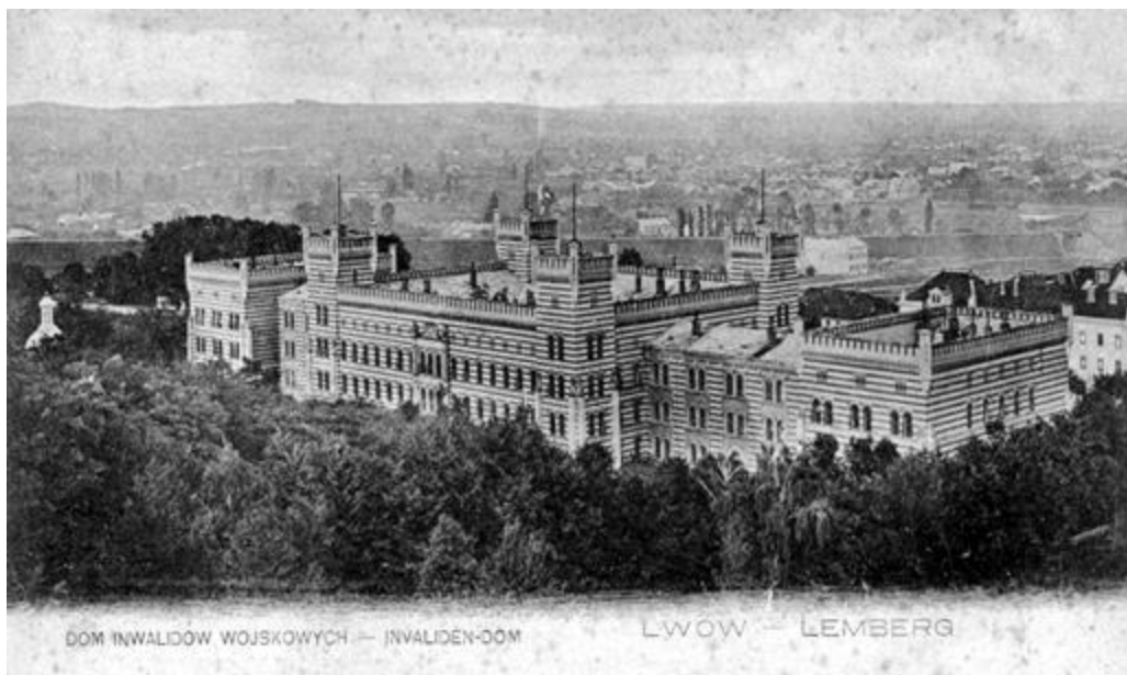
Рис. 25. Дім військових інвалідів у Львові. Листівка 1914-1915 рр.

Дім військових інвалідів діяв у Львові з 1863 до 1918 року. У міжвоєнний період будівлі використовували для потреб інвалідів і ветеранів польського війська: притулок для військових ветеранів та хірургічне відділення Окружного військового шпиталю.