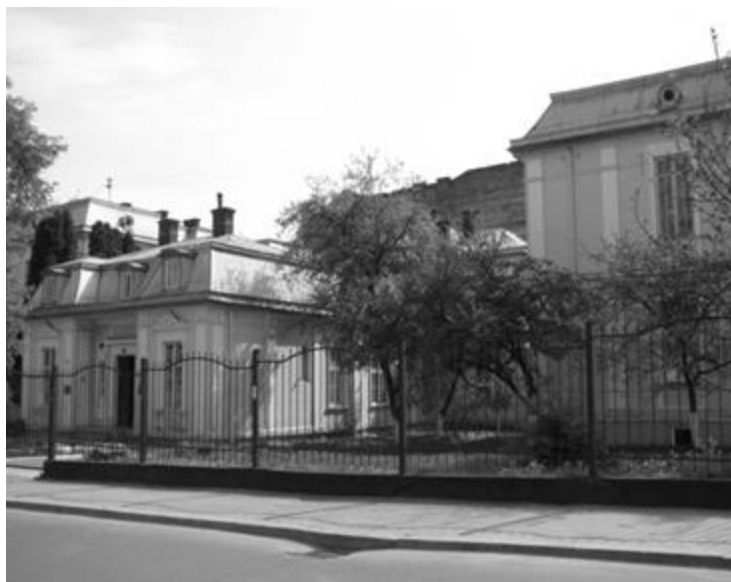
Рис. 20. Дитяча лікарня св. Софії, на даний час – отоларингологічне відділення Львівської обласної лікарні. 2013 р.

За ініціативи Товариства в 1845 р. було закладено Шпиталь для бідних дітей , який спочатку знаходився в орендованому приміщенні при закладі св. Терези. Одночасно у ньому могло лікуватись 12 дітей. У 1854 р. було споруджено власний будинок, зокрема, за доброчинні кошти княгині Ядвіги Сапєги, де було розгорнуто вже 40 ліжок. Із 1875 р. з метою утримання цього шпиталю було створено окреме «Шпитальне товариство для бідних дітей св. Софії», у 1878–1880 рр. за кошти його членів було збудовано власний будинок для дитячої лікарні на Личаківському передмісті, поблизу Загального шпиталю, здійснювалось повне медичне та матеріальне забезпечення хворих дітей з бідних родин. Спочатку нова лікарня була розрахована на 72 ліжка та 2 відділення: внутрішніх та хірургічних хвороб, а також, амбулаторія [15]. В подальшому в зв'язку із необхідністю надання фахової допомоги дитячому населенню Львова та околиць було збудовано ще один будинок, так званий павільйон для інфекційних хворих. У 1885 р. ліжковий фонд зріс до 110 ліжок [28]. Управління лікарнею та товариством здійснював комітет під керівництвом голови. В різні періоди цю функцію виконували княгині Ядвіга Сапєга, Кароліна Понінська [20, 29].