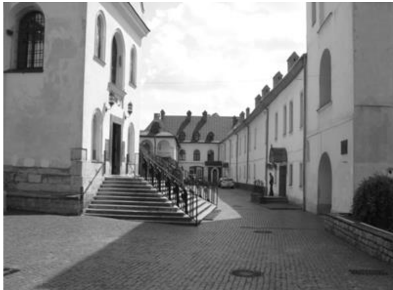
Рис. 2. Шпиталь Успенського братства у Львові – сучасний комплекс монастирських споруд св. Онуфрія: ліворуч – церква, праворуч – дзвіниця, келії ченців та приміщення колишнього шпиталю. Фото автора. 2014 р.

Шпиталь при церкві Благовіщення існував із 1542 р., церква знесена 1784 р. Ще два шпиталі побіжно згадуються при церкві св. Миколая – з 1623 р., та св. Параскеви П'ятниці – з 1743 р.