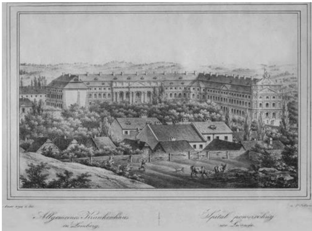
Рис. 10. Колегія Піярів, Загальний шпиталь у Львові. Ліпографія К. Ауера, біля 1830–1835 рр.

Практично в кожному повітовому місті функціонував загальний шпиталь, метою якого було лікування хворих без різниці віросповідання та національності. Фахова медична допомога надавалась лікарями, догляд за хворими здійснювався в переважній більшості сестрами милосердя.