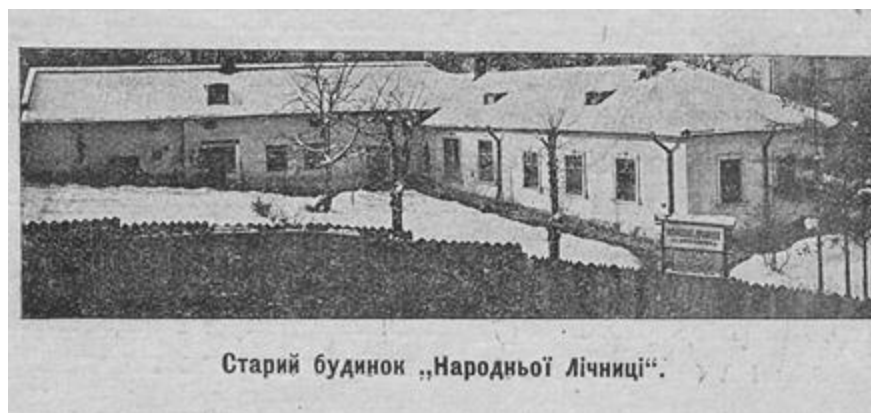
Рис. 15. Будівля амбулаторії «Народної лічниці», на даний час зруйнована.

З метою покращання лікарської допомоги населенню Львова та прилеглих територій, у Львові у 1902 р. було створене товариство «Народна лічниця», до складу якого ввійшло понад 800 членів. Упродовж дуже короткого терміну було проведено збір коштів для майбутнього закладу, митрополит Андрей Шептицький 18 віддав свій будинок, лікар Євген Озаркевич (1861–1916) закупив у Відні обладнання. Вже 1 жовтня 1903 року було відкрито амбулаторію «Народна лічниця»: як вказано у статуті: «для несення дарової лікарської помочі мешканцям Львова і цілої Галичини без різниці віроісповідання і народності» 19 . Спочатку лічниця мала 4 амбулаторні відділи: внутрішніх і дитячих хвороб, хірургічний, офтальмологічний та жіночий. У 1912 році лічниця розширилась до 8-ми відділів [21].