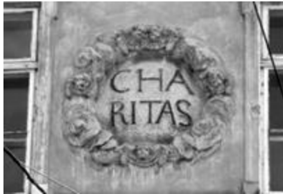
Рис. 27. Барельєф на стіні давнього шпиталю Боніфратрів (будівництво 1659–1693) з написом «Милосердя». 2013 р.

Ще до офіційного переходу соціального забезпечення до рук держави створювались страхові організації за принципом самострахування: за рахунок внесків працівників реалізовувалась можливість соціального та медичного захисту певного рівня. Знаково, що однією з перших організацій такого гатунку в Україні ( можливо – першою! ) був заклад для підтримки та лікування хворих працівників потпонової фабрики у Винниках під Львовом, створений у 1810 р. на внески працівників та урядників.