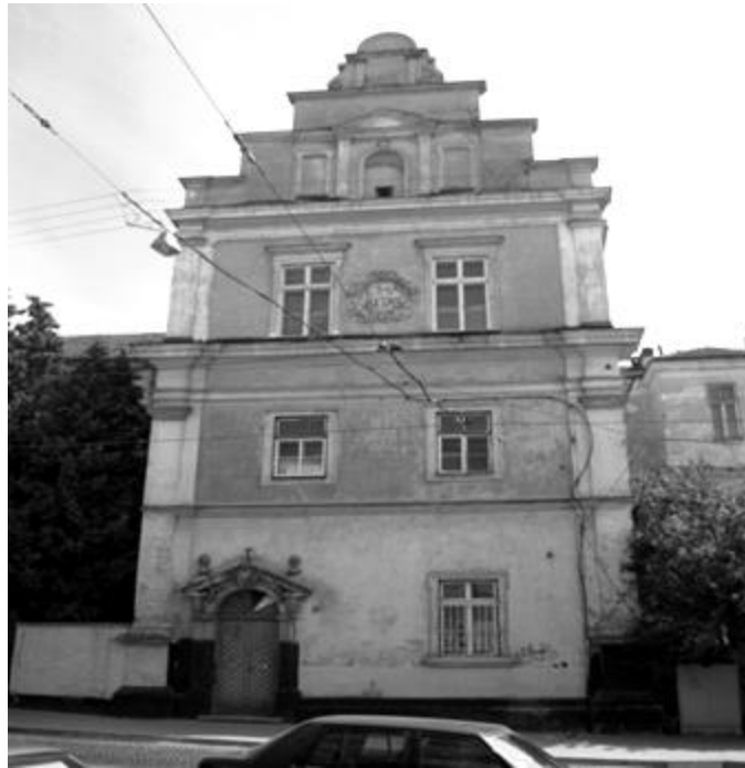
Рис.4. Давня будівля шпиталю Боніфратрів по вул. Личаківській, сучасний – військовий шпиталь. 2014 р.

Сама споруда Колегії Піярів будувалась за кошти єпископа ордену Піярів Самуеля Роха Гловінського (1703–1778) у 1748–1762 роках та призначалась для навчання бідних дітей шляхетного походження. Оскільки будинок було спроектовано велично, коштував він відповідно: 60 тис. фл. пол., у 1763 р. – о. Гловінський додатково віддав у фонд власність у Винниках та Підберізцях 10 , колишній палац Вишневецьких на Глинянському передмісті 11 [14]. Фундатор розраховував на навчання двадцяти дітей, але після його смерті все занепало, і, як наслідок, – у занедбане приміщення було переведено шпиталь Боніфратрів.