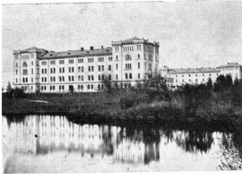
Рис. 21. Заклад для бідних сиріт Станіслава Богдана Скарбка в Дроговижу. Фото 1930-их рр.

Товариство також фінансувало філію в Івонічу 25 , де щороку 40 дітей отримували можливість лікуватись під лікарським наглядом [13]. У 1910 р. лікарня була об'єднана із Загальним Шпиталем зі створенням 3-х дитячих відділень.