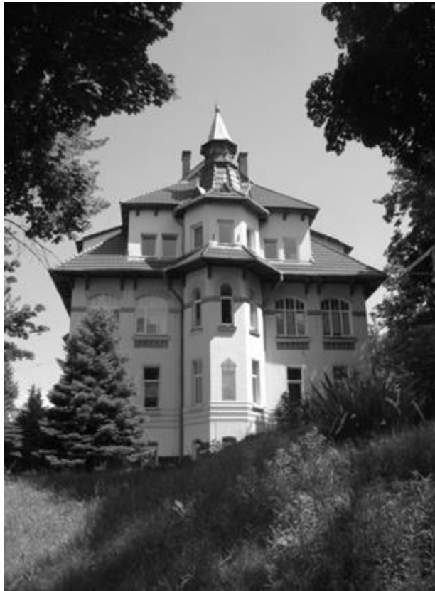
Рис. 24. Дім здоров'я доктора Солецького, в подальшому – Санаторій Польського Червоного Хреста, сучасний клінічний шпиталь прикордонної служби. 2014 р.