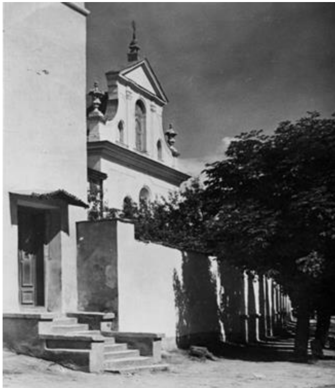
Рис. 7. Монастир св. Казимира. 1938 р. Архівне фото

У Львові з 1714 р. Сестрами Милосердя (Шарітки) 12 було закладено монастир та шпиталь святого Вінсента де Поля. За деякими джерелами шпиталь був закладений у 1741 р. на кошти Францішека Завадського з метою лікування та догляду 100 бідних хворих [15]. Крім шпиталю на території знаходилась невелика монастирська каплиця та аптека для власного користування. У 1783 році шпиталеві віддано приміщення щойно скасованого монастиря Реформатів 13 із костелом святого Казимира, що знаходились поруч. У нових приміщеннях було облаштовано сиротинець, названий на честь святого Казимира. У 1870 р. Сестер Милосердя було запрошено до роботи у Крайовому Загальному шпиталю у Львові [16].