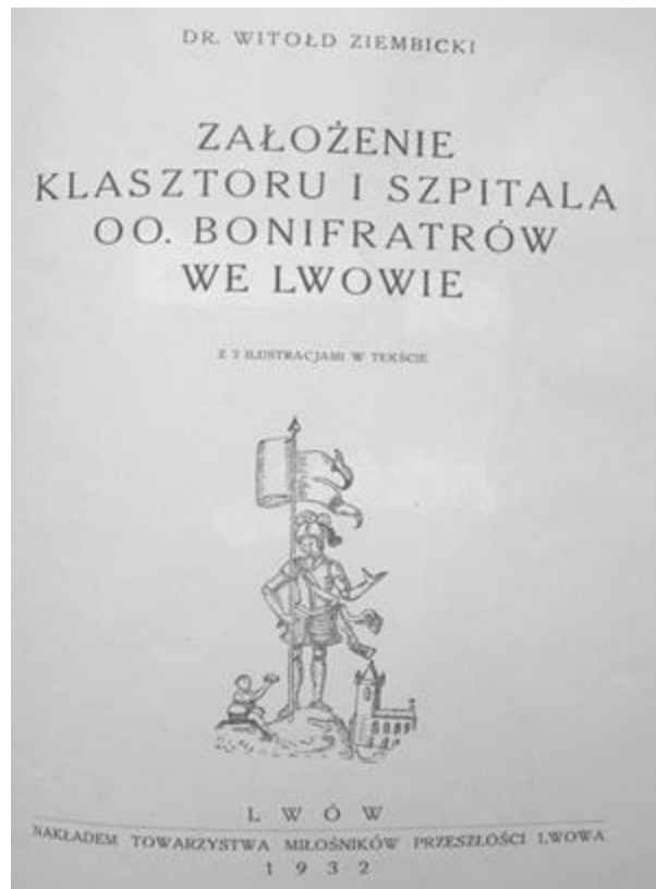
Рис. 3. Титульна сторінка угоди Яна Собеського про надання коштів для шпиталю отців Боніфратрів. Малюнок мав свідчити про милосердя фундатора. Витяг з книги Вітольда Зембіцького «Закладення монастиря та шпиталю отців Боніфратрів», Львів, 1932

ломників. У 1616 р. міські цехи гончарів і поворозників 8 вимурували капличку для розміщення образу св. Лаврентія. У 1659 р. яворівським старостою Яном Собеським було засновано фундацію, згідно з якою майбутній король Польщі 9 надає кошти для будівництва костелу, монастиря та шпиталю Боніфратрів. За задумом засновника в шпиталю мала надаватись допомога хворим людям, у тому числі колишнім військовим. Будівництво шпитального будинку тривало з 1688 до 1693 р. (за деякими джерелами – до 1695-го). Загальна сума, вкладена в будівництво, склала 100 тисяч злотих [10].