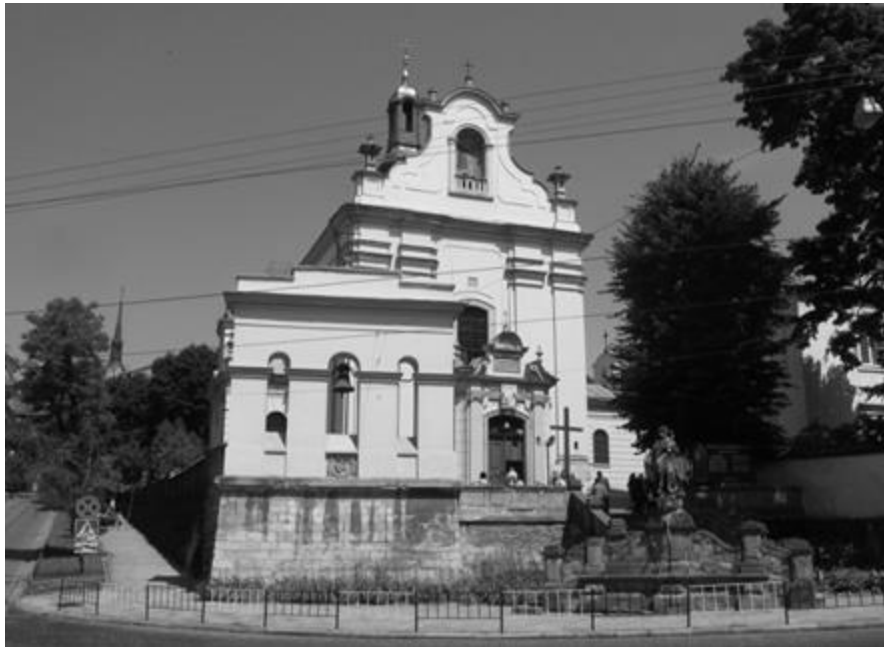
Рис. 26. Костел св. Антонія з Падуї з монастирськими приміщеннями (праворуч), в яких розташовувався виховний заклад для хлопчиків (на даний час – музична школа). 2014 р.