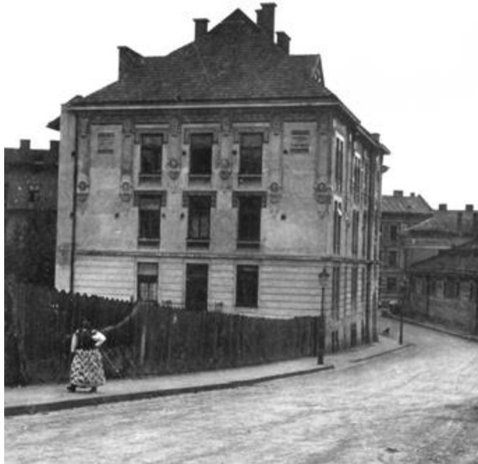
Рис. 22. Будівля монастиря отців Студитів, в якій був розгорнутий шпиталь для бійців українського стрілецтва. 1910–1914 рр. Архівне фото

В цьому ж ряду можна назвати кооператив «Лікарська самопоміч», який існував у Львові з 1931 року при Українському лікарському товаристві на внески лікарів та надавав матеріальну допомогу вдовам і сиротам лікарів.