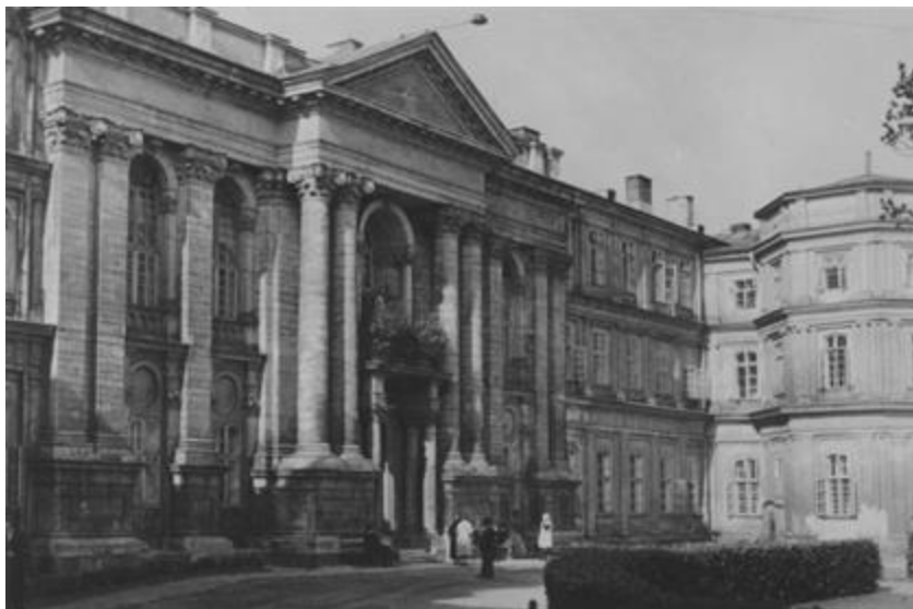
Рис. 5. Колегія Піярів. 1932 р. Архівне фото