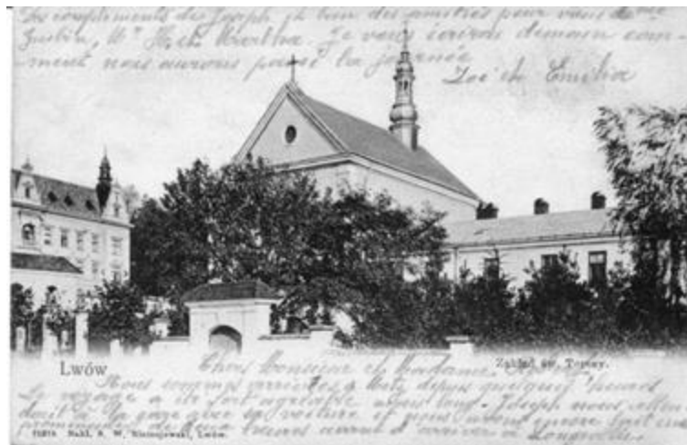
Рис. 18. Заклад св. Терези. Листівка 1901–1904 рр.

До цього переліку можна додати Інститут бідних християн у Львові: створений у 1785 р. відповідно до декрету імператора Йосипа II. Мета: утримання непрацездатних християн, мешканців Львова та прилеглих територій. На жаль, дана інституція певний час активно не розвивалась. Тільки у 1811 р. за підтримки тогочасного губернатора на його основі було створено Заклад опіки закритого Інституту бідних християн міста Львова для дорослих і старих, непридатних до праці. Від 17.10.1888 р. діяв спеціальний статут, затверджений намісництвом [26].