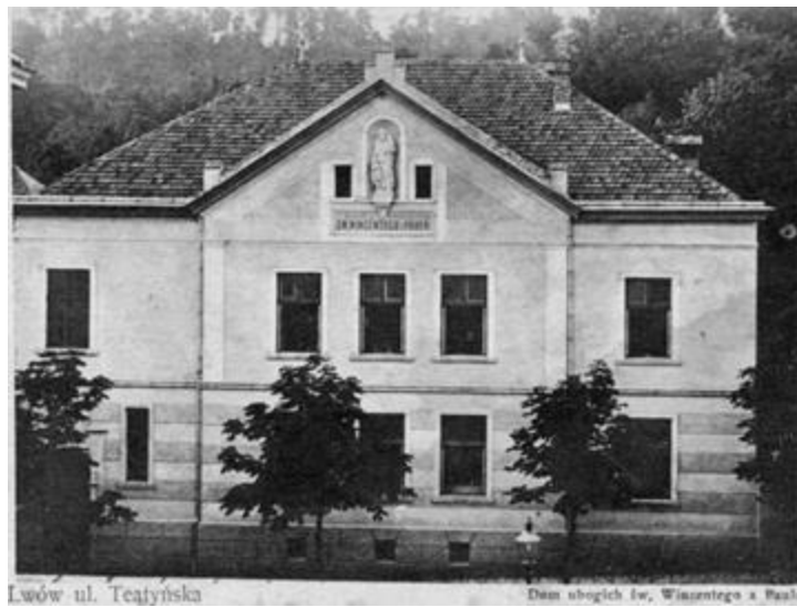
Рис. 6. Дім убогих св. Вінсента де Поля. Листівка – цеголка, прибуток призначався Товариству сестер милосердя згромадження св. Вінсента де Поля. 1910 р.

У Львові з 1714 р. Сестрами Милосердя (Шарітки) 12 було закладено монастир та шпиталь святого Вінсента де Поля. За деякими джерелами шпиталь був закладений у 1741 р. на кошти Францішека Завадського з метою лікування та догляду 100 бідних хворих [15]. Крім шпиталю на території знаходилась невелика монастирська каплиця та аптека для власного користування. У 1783 році шпиталеві віддано приміщення щойно скасованого монастиря Реформатів 13 із костелом святого Казимира, що знаходились поруч. У нових приміщеннях було облаштовано сиротинець, названий на честь святого Казимира. У 1870 р. Сестер Милосердя було запрошено до роботи у Крайовому Загальному шпиталю у Львові [16].