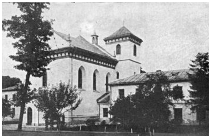
Рис. 1. Шпиталь та монастир св. Лазаря на вул. Коперника у Львові. Листівка 1920-х рр.

Лаконічні повідомлення про шпиталь св. Станіслава , при якому функціонував лепрозорій, походять із 1404 р. (за деякими припущеннями – з 1425 р.) [5]. Комплекс монастирських споруд, в який входили готичний костел св. Станіслава Єпископа і Мученика , що був закладений близько 1370 року, монастир, шпиталь, трупарня – розташовувались по ліву сторону від сучасного Оперного театру 5 . Хоча проказа в Львові загалом не мала такого масового характеру, як у Європі, та для цих особливих хворих збудували лепрозорій. За різними історичними джерелами, в корпусі могли одночасно перебувати до 40 прокажених. Із майже чотирьох століть існування шпиталю св. Станіслава лепрозорій при ньому функціонував близько ста років. Ступінь медичної опіки в ньому був мінімальним. Для уражених проказою шпиталь виконував функції швидше дожиттєвого притулку, аніж лікувального закладу. Розібрали шпиталь у 1794 році [6].