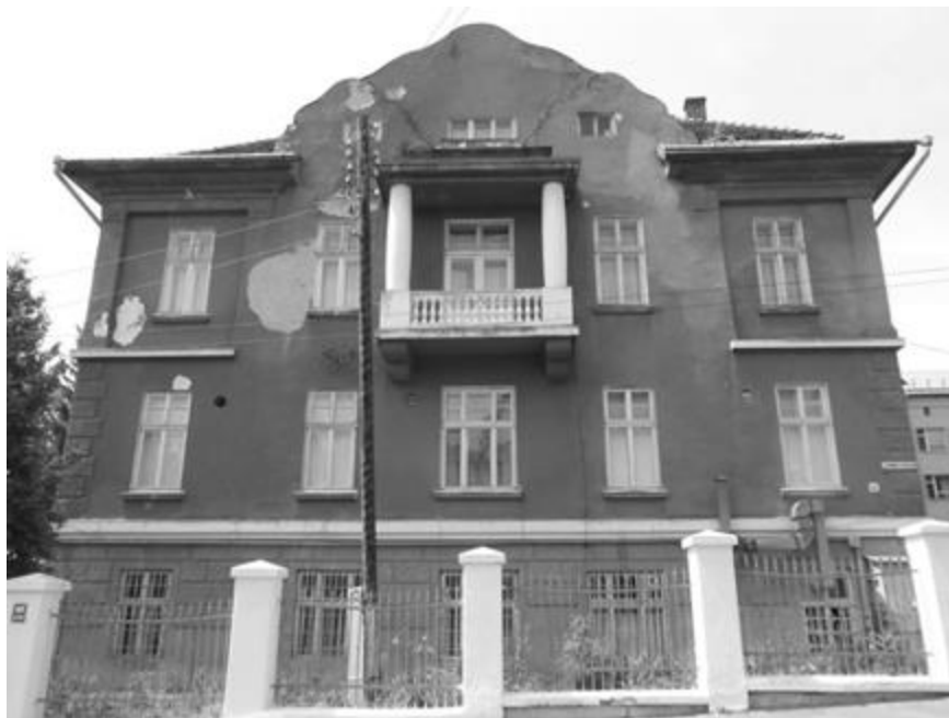
Рис. 12. Будинок шпиталю у Дрогобичі, сучасна поліклініка. Фото 2014 р.