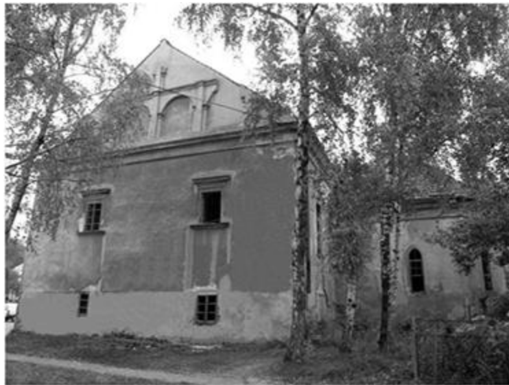
Рис. 17. Будинок убогих у Золочеві – сучасний вигляд

У Львівському повіті відомий Фонд убогих у Наварії, закладений у 1771 р. мешканцем Рохом Вінявським з метою підтримки місцевих бідних. Аналогічні фонди існували: з 1805 р. у Щирцю, закладений за кошти римокатолицького священика Ігнація Антонія Загліньського; з 1813 р. у Збоїщах та Грибовичах, фундатор Ян Непомук Нікорович [15]. Фонд убогих у Зимній Воді та Басівці 24 був започаткований у 1844 р. за кошти львівського католицького священика Францішека Тома [25].