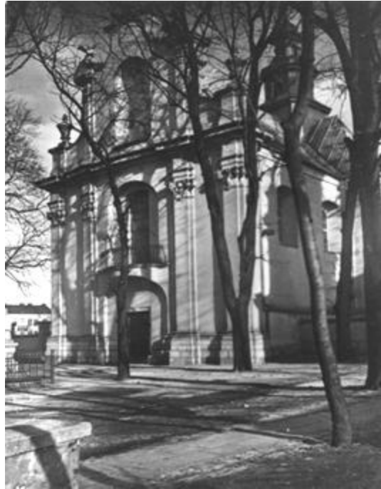
Рис. 8. Костел св. Мартина. Фот. А. Ленкевич. 1938 р. Архівне фото

Уся інституція Сестер Милосердя була ліквідована після Другої світової війни. На даний час увесь комплекс будівель колишнього храму, шпиталю та монастиря шариток використовується Університетом внутрішніх справ.