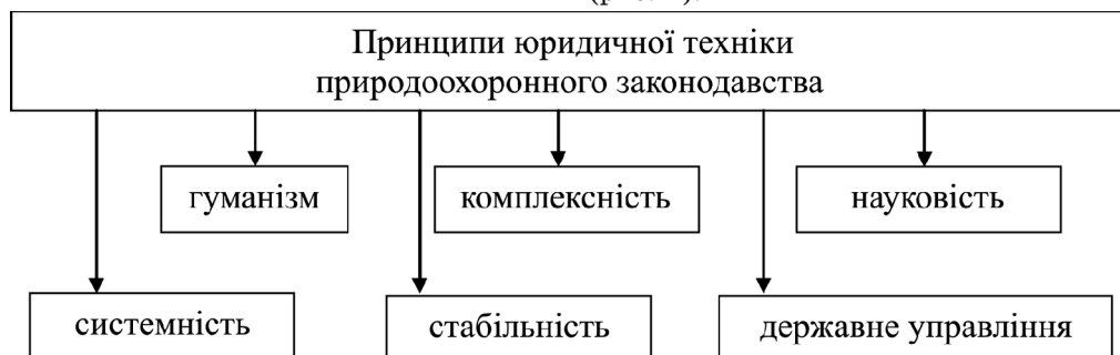
Рис. 1. Принципи юридичної техніки природоохоронного законодавства.

Алгоритм реалізації принципів юридичної техніки природоохоронного законодавства містить декілька етапів: світоглядне формування в суспільстві необхідності вирішення конкретної природоохоронної проблеми, що вимагає свого законодавчого регулювання та законодавчої формалізації таких положень. В юриспруденції під принципами права розуміють основні положення та ідеї, які виражають сутність і соціальну обумовленість права, а їх зміст має важливе значення для правотворчої і практичної діяльності. Принципи пронизують усі правові норми, являють собою важливий елемент нормативно-правових актів, визначають положення, які лежать у їх основі. Як вказує А. М. Колодій, принципи права виконують нормативно-регулятивні функції, тобто набувають значення загальних правил поведінки, яким властивий загальнообов'язковий державно-владний характер [12, с. 27]. Розглядаючи зміст юридичної техніки природоохоронного законодавства, можна віднести до їх числа наступні: 1) гуманізм; 2) комплексність; 3) науковість; 4) системність; 5) стабільність; 6) державне управління (рис. 1).