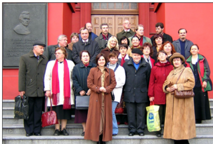
Рис. 6. Учасники конференції 2004 р. Fig. 6. Conference participants of 2004

Одним з векторів діяльності кафедри є участь у міжнародних організаціях та проведенні спільних міжнародних досліджень. Упродовж останніх 15 років підтримувались постійні контакти з науковцями Паризького, Львівського університетів та Національного Музею природничої історії (Франція), Техаського університету (США), Університету Мейдзі (Японія), Університету міста Берн (Швейцарія), Археологічного музею міста Скоп'є (Північна Македонія), Інститутами археології Ягеллонського університету (Краків), Університету Марії Кюрі-Склодовської (Люблін), Варшавського та Жешовського університетів (Польща), Інституту пре- і протісторії Університету Крістіана-Альбрехта в м. Кіль (Німеччина) тощо.