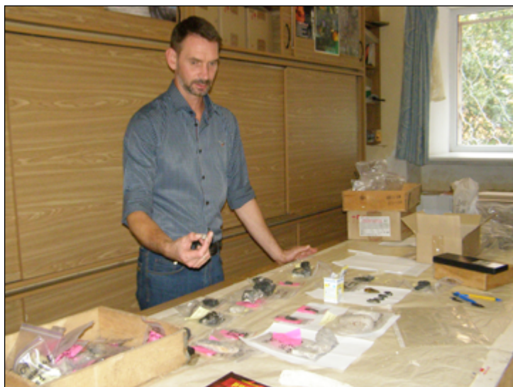
Рис. 4. У реставраційній лабораторії (2018 р.)