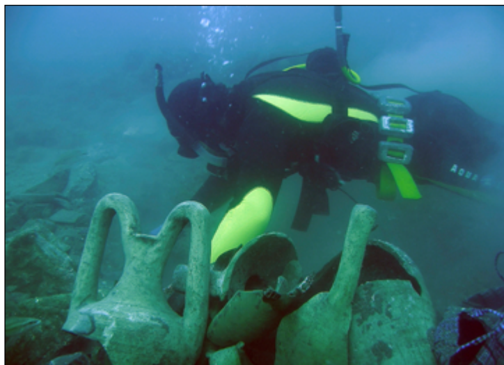
Рис. 5. Дослідження Центру підводної археології (Новий Світ, 2013 р.)

Fig. 5. Research of the Centre for Underwater Archaeology (Novyi Svit, 2013)