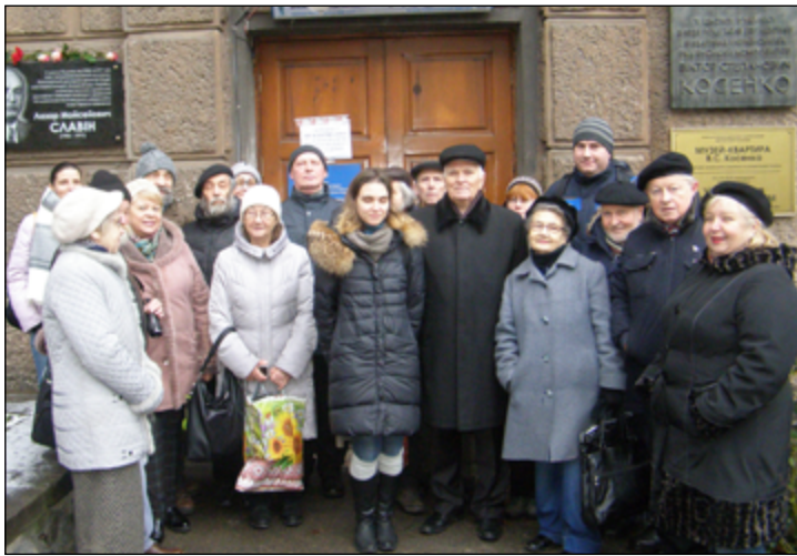
Рис. 1. Відкриття меморіальної дошки на будинку, в якому мешкав Л.М. Славін (30 листопада 2017 р.)

Fig. 1. Opening of a memorial plaque on the house where L.M. Slavin lived. (November 30, 2017)