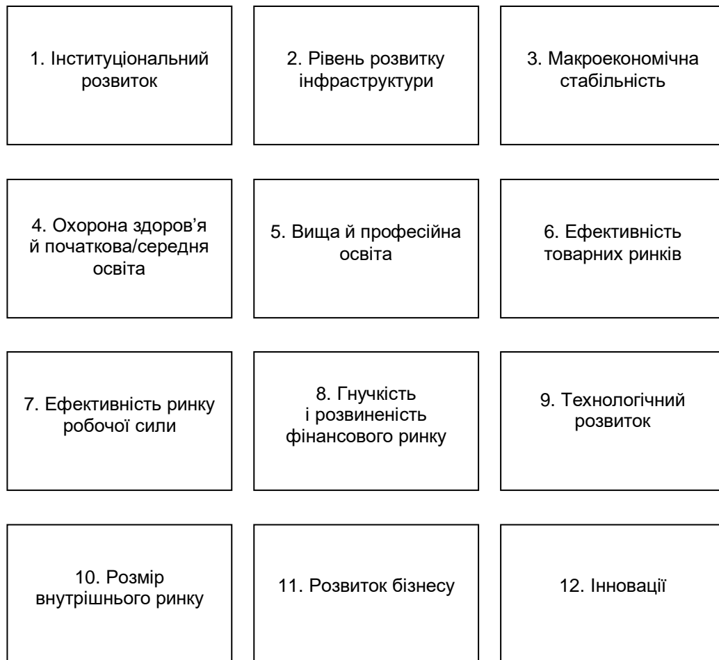
Рис. 1. Чинники конкурентоспроможності

Цей індекс замінив індекс конкурентоспроможності економічного зростання, оскільки останній уже не повною мірою відображав стан національних економік в умовах глобалізації. У його розрахунках ВЕФ використовуються до 200 показників, об'єднаних у групи (рис. 1).