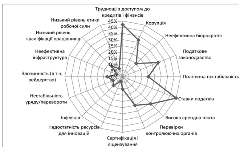
Рис. 2. Проблеми ведення ефективної діяльності суб'єктами малого підприємництва в Україні

У контексті цього впливає необхідність аналізу основних проблем ефективної роботи підприємств такого типу в Україні. До основних з них можна віднести кредитування, корупцію, податкове законодавство та ставки податків тощо (Рис. 2).