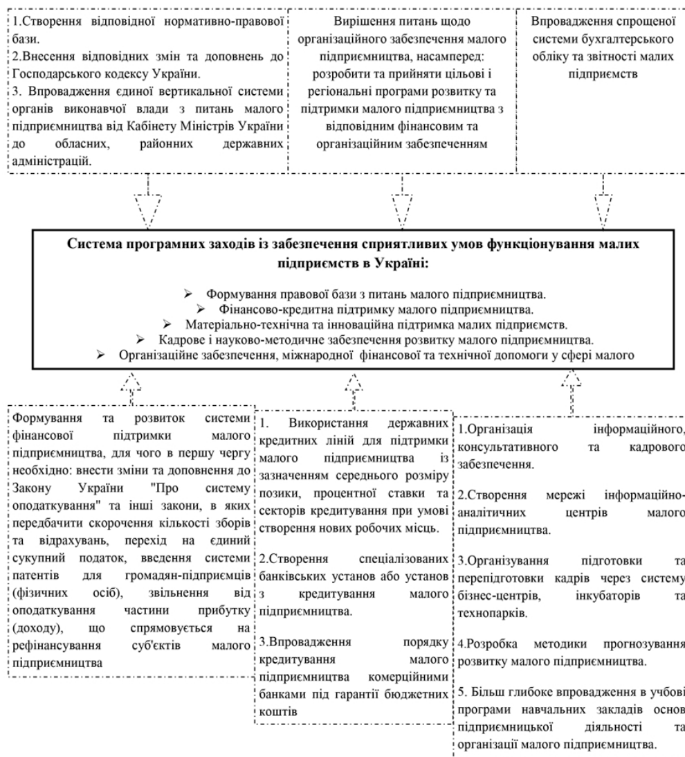
Рис.6. Основні напрями забезпечення сприятливих умов функціонування малих підприємств в Україні

напрямами їх розв'язання мають стати зміни в законодавчих та нормативно-правових документах, регіональних програмах розвитку, спрощення систем бухгалтерського обліку та оподаткування; ефективна організація фінансування та інвестування в малий бізнес, підготовка кваліфікованих кадрів тощо (Рис.6)