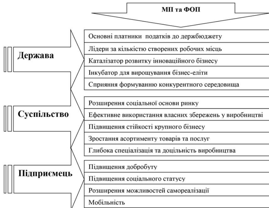
Рис. 1. Вплив МП та ФОПів на розвиток основних економічних категорій Джерело: розроблено автором

Незважаючи на невеликі розміри, соціально-економічну значущість і МП, і ФОПів складно переоцінити. Якщо розглядати їх вплив у трьох основних економічних категоріях: держава, суспільство, підприємець, то можна виокремити значні позитивні результати (Рис. 1).