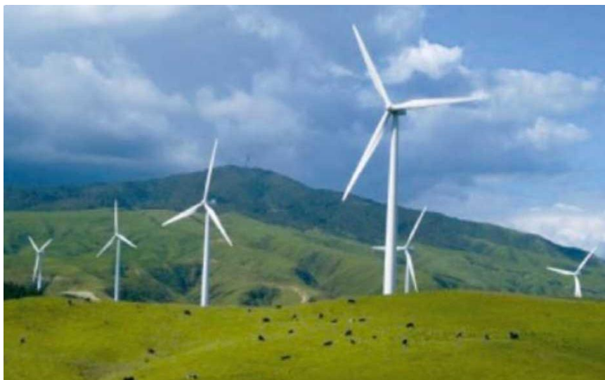
Рис. 1 – Вітроустановки з заглибленим фундаментом