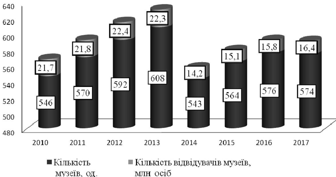
Рисунок 1 — Кількість музеїв та кількість їх відвідувачів (складено авторами на основі [19])

Згідно з дослідженнями, абсолютна більшість українців (95 %) продовжує вважати, що в країні криза. Зростання песимістичних настроїв помітне і по тому, що в 2017 році тільки 66 % наших співвітчизників не вірили в те, що країна зможе перемогти кризу в найближчий рік, а зараз в це вже не вірять 77 % українців.