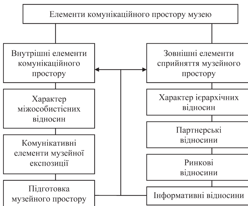
Рисунок 2 — Елементи комунікаційного простору музею (складено авторами)

Можна говорити про те, що комунікаційний простір музею