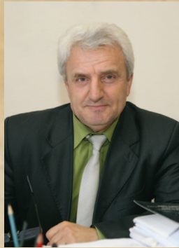
Олександр ЛИСЕНКО, завідувач відділу історії України періоду Другої світової війни Інституту історії України НАН України, доктор історичних наук, професор