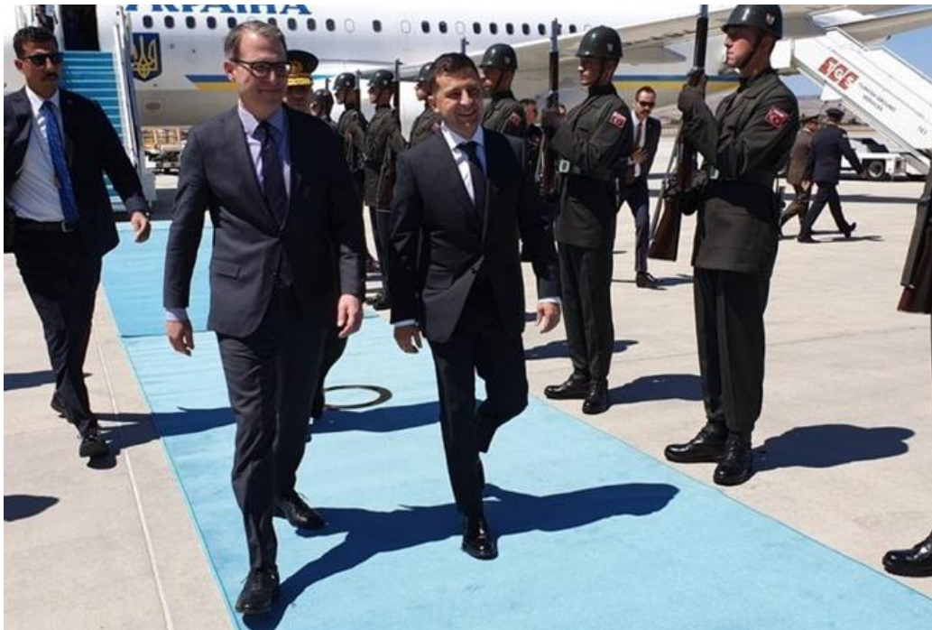
Зеленский о самолетах.