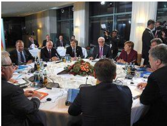
Сирийская дорога на Донбасс

«Никто не согласится на такое. Это же прямой суицид. Нас зажмут в кольцо. Думаю, даже выборов тогда не будет, ВСУ пойдут в наступление и на зачистку Донбасса. В это время ОБСЕ и ЕС будут просто высказывать свою обеспокоенность, как они это умеют делать», — говорит «Росбалту» военнослужащий Народной милиции ЛНР.