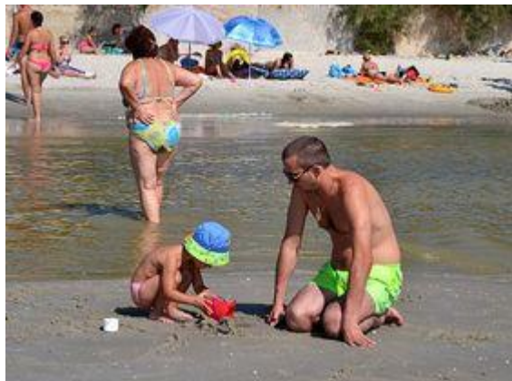
Номер с видом на море и войну

По поводу «разнодетости» всех этих персонажей в свое время днепродзержинцы даже анекдот сочинили, но теперь, получается, его не про кого рассказывать.