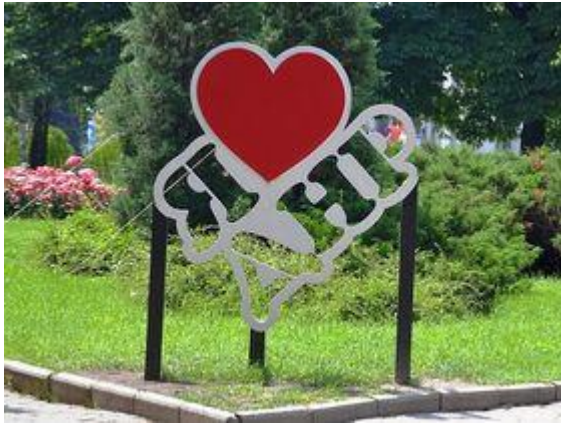
«Потерпим — иначе никак»

Новое имя городу выбрали быстро, особо не интересуясь мнением жителей. Они повозмущались немного в соцсетях, особо активные граждане устроили пару незначительных акций протеста, но власти приняли свое решение. Уверения в том, что оплачиваться последствия переименования — замена земельных планов, кадастров, паспортов, уличных вывесок — будут не из кармана рядовых обывателей, не вызывает у народа доверия. Все знают, что в городском бюджете нет достаточных средств ни на медицину, ни на образование.