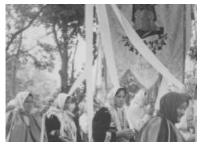
"Polska w podróży"