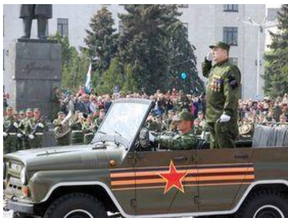
ЛНР рискует стать «круглой сиротой»