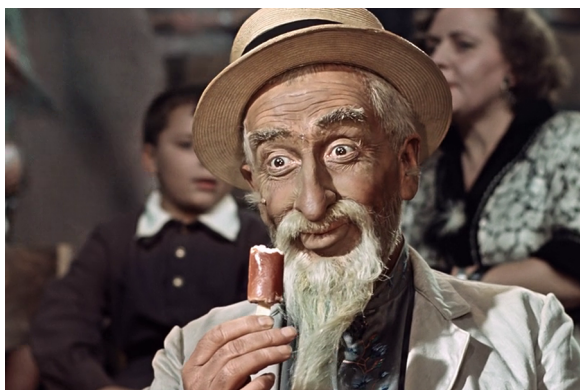
Кадр из фильма «Хоттабыч»

https://express-k.kz/news/ekskursiya/balmuzdak_ot_eskimoso-135761?sphrase_id=3393359