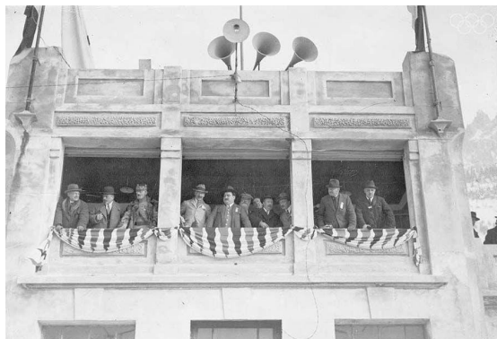
Вип-трибуна Зимней Олимпиады в

Эра зимних Олимпийских игр началась 24 января 1924 года – со дня открытия Зимней спортивной недели, как из-за каприза Международного олимпийского комитета первоначально назывались те соревнования. Но через год под давлением международной общественности МОК признал-таки их первой Белой Олимпиадой. В результате зимние Олимпийские игры достигли сегодня почтенных 95 лет.