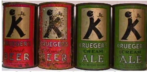
Первое баночное пиво «Krueger Cream Ale» в железных банках