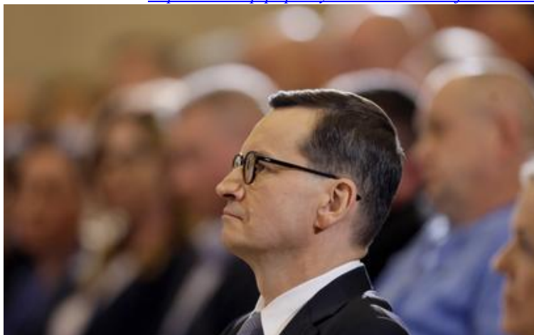
Premier Mateusz Morawiecki

https://www.rp.pl/polityka/art37458991-jacek-nizinkiewicz-pytania-na-ktore-rzad-nie-odpowiada