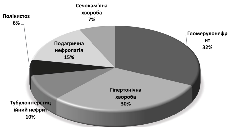
Рис. 1. Розподіл обстежених хворих на ХХН 5Д ст. за нозологіями.

Результати дослідження та їх обговорення. Серед основних причин, що призвели до розвитку термінальної ниркової недостатності в обстежуваних пацієнтів превалювали гломерулонефрит та гіпертензивна нефропатія (кожний третій пацієнт), найменше хворих визначалось з сечокам'яною хворобою та полікістозом нирок (рис.1).