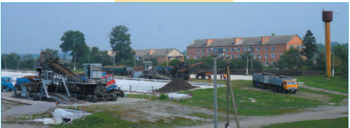
Кагатне поле заводу, 2012 рік

У 2012 році на заводі здійснено, як і щороку, на заводі проведено ряд реконструкцій: було