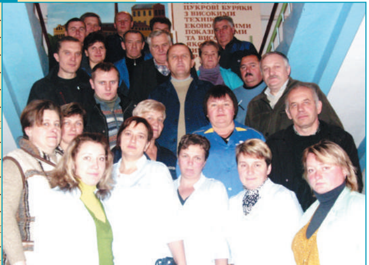
Частина колективу ІТР

стало поєднання досвіду та технічних інновацій у виробництві. Високий науковий та інженерно-технічний потенціал, гнучке виробництво, оснащене новітнім устаткуванням, активний маркетинг до-