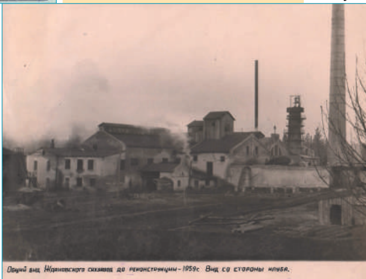
Обичай вид Ждановського сахарного заводу до реконструкції - 1959г. Вид со сторони міста.

Існуюча технічна база заводу, зношена за 108 років експлуатації, була не в змозі переробити такий обсяг сировини. Саме тому, Жданівський цукровий завод через брак виробничих потужностей частина цукрових буряків щороку передавалася сусідньому Уладівському цукровому заводу.