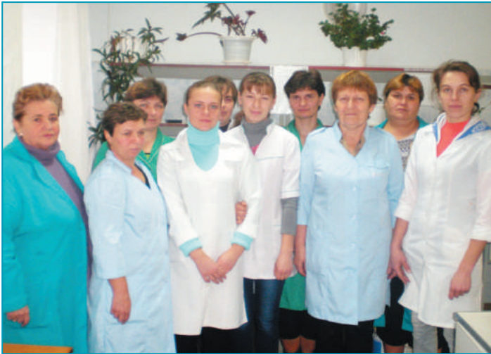
Лаборанти та головний технолог лабораторії цукрового заводу

вав передові технології. Сьогодні нам вдалося головне: ми створили згуртовану команду однопідприємців, компетентних інженерних і технічних фахівців, націлених на безперервний рух вперед. Нашим девізом