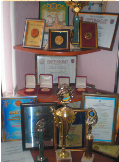
Нагороди Жданівського цукрового заводу

новий рівень виробництва. Сьогодні Жданівський цукровий завод виробляє продукцію, яка повністю відповідає європейським стандартам якості. На підприємстві впроваджено систему менеджменту якості у відповідності до вимог міжнародних стандартів, а саме систему управління безпечністю харчових про-