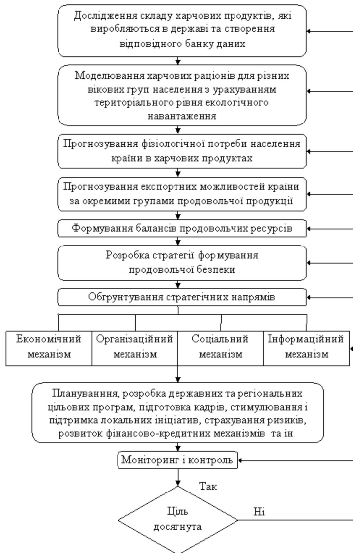
Рис. 1. Алгоритм формування і реалізації аграрної політики продовольчої безпеки

Процес формування продовольчої безпеки передбачає тісний взаємозв'язок між агропромисловою, сільськогосподарською, продовольчою, зовнішньоекономічною політикою, діяльністю щодо забезпечення якості і безпеки продовольства та раціонального харчування населення. Вплив на агропродовольчу сферу, яка формує пропозицію на продовольство, доповнюється заходами стимулювання попиту на нього шляхом реалізації соціальних програм, метою яких є забезпечення достатнього рівня харчування усіх категорій населення, забезпечення ефективної зайнятості, демонополізації продовольчого ринку, здійснення цінової політики щодо обмеження рентабельності та торговельних націнок на базові продукти харчування до економічно обґрунтованого рівня.