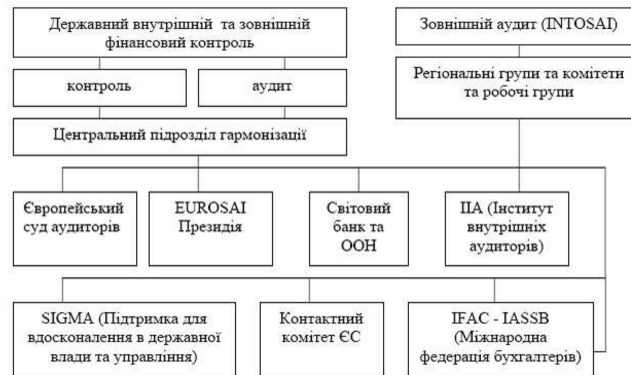
Рис. 1. Схема організації державного фінансового контролю в Європейському Союзі

Можна зазначити, що одну з головних ролей в організації державного фінансового контролю в ЄС відіграє Міжнародна організація вищих органів фінансового контролю (ІНТОСАІ). Яка працює в якості головної організації для зовнішнього державного аудиту протягом більше 60 років та встановлює інституціональні правила для вищих органів фінансового контролю з метою сприяння розвитку і передачі знань, поліпшення державного аудиту в усьому світі і підвищення професійних можливостей. ІНТОСАІ є автономною, незалежною і неполітичною організацією [8]. Це неурядова організація зі спеціальним консультативним статусом при Економічній і Соціальній Раді Організації Об'єднаних Націй, яка була заснована в 1953 році і в даний має 192 повноправних членів і 5 асоційованих членів. Рада керуючих ІНТОСАІ визнала сім регіональних робочих груп (рис.2). Україна зараз активно розвиває співробітництво з EUROSAI [6].