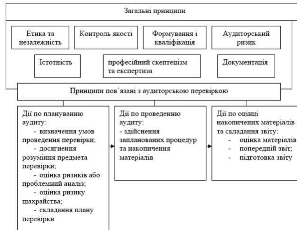
Рис. 3. Фундаментальні принципи ISSAI 100

ІНТОСАІ досягає своєї місії за допомогою різних органів, програм і заходів. Основними органами є: конгрес, Рада керуючих, Генеральний секретаріат і Регіональні робочі групи; Комітет з фінансів та адміністрації готує рішення, які будуть затверджені Радою керуючих [8]. Директор зі стратегічного планування забезпечує ефективну координацію та реалізацію Стратегічного плану. ІНТОСАІ розробила Міжнародні стандарти вищих органів фінансового контролю (ISSAI), які містять професійні стандарти і керівні принципи найкращої практики для аудиторів державного сектора, офіційно уповноважених і схвалених Міжнародною організацією вищих органів фінансового контролю. Розроблені також ISSAI 100 (Фундаментальні принципи), які є загальними для всіх видів і форм аудиторських перевірок (рис.3) [5].