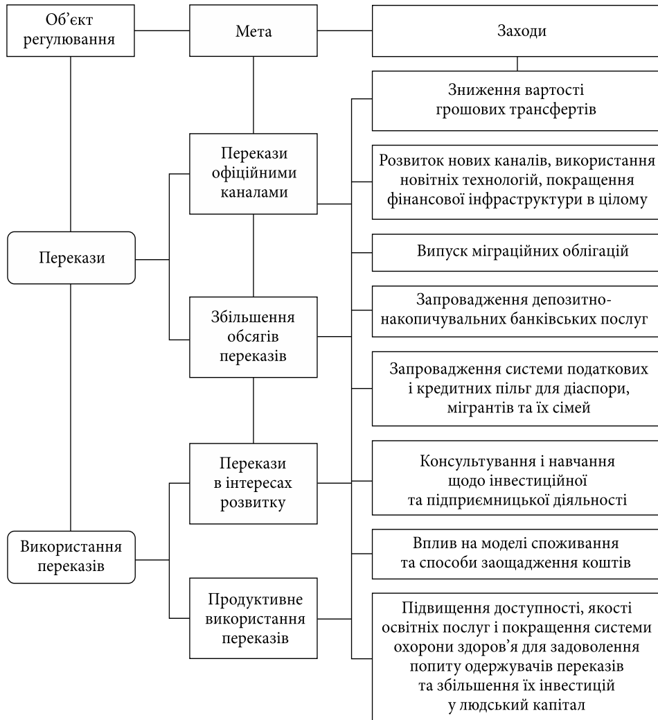
Рис. 3. Напрями і заходи державної політики щодо грошових переказів мігрантів

Таким чином, можна виокремити два напрями політики, пов'язаної з грошовими переказами мігрантів (рис. 3):