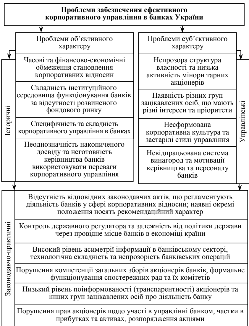
Рис. 2. Проблеми забезпечення ефективного корпоративного управління

Якість управління в кредитній організації зовсім не є лише внутрішньою справою самих професійних банкірів. Виконуючи ряд публічних функцій в економіці, банки діють на перетині ін-