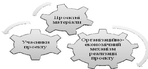
Рис. 2. Структура інвестиційного проекту

Для визначення особливостей управління проектом потрібно його структурувати. Структура проекту — організація зв'язків між його елементами. Як бачимо з рис. 2, структура інвестиційного проекту характеризує його цілісність та єдність усіх елементів.