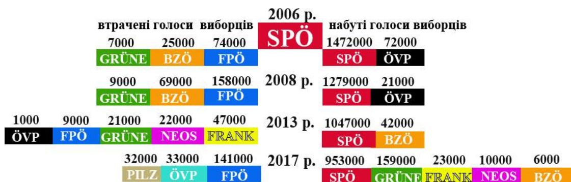
Рис. 2. Походження голосів СДПА: втрати та придбання

Аналіз потоків виборців між парламентськими партіями (НЕТТО) останніх чотирьох виборчих циклів в Австрії дає нам можливість виділити специфіку втрати голосів СДПА. Так, якщо в Німеччині голоси соціал-демократів переходили до вкрай лівих і правих, у Франції – центристів і вкрай лівих, а в Нідерландах – до всіх точок спектра [18], то в Австрії спостерігається стійка тенденція переходу більшої кількості голосів до правих популістів. Згідно рис. 2. з виборців СДПА в 2002 р. 99000 в 2006 р. віддали свої голоси партіям «Альянс за майбутнє Австрії» (АБА, нім. Bündnis Zukunft Österreich, BZÖ) і АПС; 227000 виборців, що проголосували в 2006 р. за СДПА, в 2008 р. проголосували за АБА і АПС; 56000 виборців СДПА в 2008 р. віддали перевагу АПС і партії «Команда Штронаха для Австрії» (нім. Team Stronach für Österreich, FRANK) в 2013 р.; 141000 тих, хто голосував в 2013 р. за СДПА, в 2017 р. віддали свої голоси АПС.