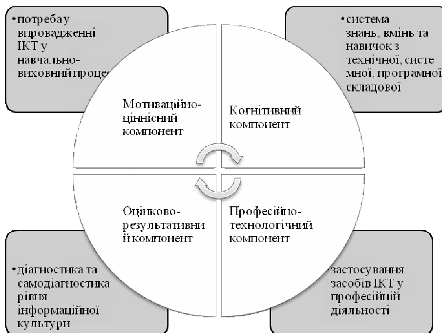
Рис. 1. Складові інформаційної культури бакалаврів з філології

Професійно-технологічний компонент — комплекс умінь і навичок студентів із застосування засобів ІКТ у професійній діяльності. Знання санітарних умов і режимів безпечного використання технічних засобів навчання і стандартів, яким повинні відповідати технічні засоби навчання.