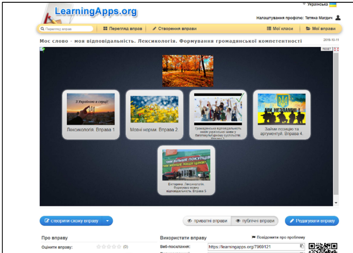
Рис. 3. Зображення першої сторінки кейсу вправ

чергою, сприяє розвитку критичного мислення, навичок самоосвіти, оргдіяльнісних умінь, розумінню відповідальності перед суспільством за культуру власного мовлення.