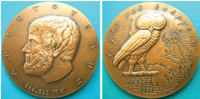
Мал. 2. Аристотель. Французька медаль.

Головний в анфас портрет Аристотеля прикрашає аверс (мал. 3) української медалі (Ø 165 мм, бісквіт, що є різновидом кераміки, автор – Ю. Харабет), створеної до V Аристотелівських читань 1990 р. в Маріуполі. По краю аверсу напис російською мовою: «ДЕМОКРАТИЯ · ГУМАНИЗМ · АНТИЧНОСТЬ» (ДЕМОКРАТИЯ · ГУМАНИЗМ · АНТИЧНІСТЬ). У центрі реверсу – Аристотель, який сидить і на сувої робить напис грецькою мовою, наведений скульптором по краю реверсу російською та грецькою мовами: «V АРИСТОТЕЛЕВСКИЕ ЧТЕНИЯ МАРИУПОЛЬ 90 Ο ΑΡΗΣΤΟΤΕΛΗΣ ΔΙΑΒΑΖΜΑ» (V АРИСТОТЕЛІВСЬКІ ЧИТАННЯ 1990 РОКУ В МАРИУПОЛІ).