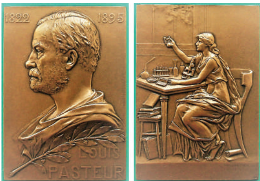
Мал. 10. Луї Пастер. Французька плакета.

Вишукану плакету (74 мм × 52 мм, бронза, ПМД), присвячену 100-річчю Луї Пастера (мал. 10), створив у 1922 р. видатний французький скульптор Georges Prudhomme. Виразний профільний, погрудний, повернений ліворуч портрет Пастера займає більшу частину аверсу плакети. У верхній частині, ліворуч та праворуч від портрета – роки життя вченого: «1822» «1895». Під портретом – лаврова гілка і, нижче, горизонтальний напис у два рядки: «LOUIS / PASTEUR». На реверсі плакети є алегоричне зображення Науки у вигляді профільного, у повний зріст, портрета молодої жінки, що розглядає колбу з результатами експериментів, сидячи в лабораторії за столом з мікроскопом та хімічним посудом. Під столом, на стільці та підлозі – книжки [18].