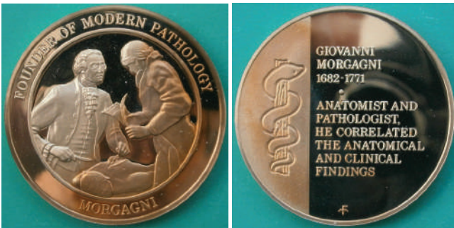
Мал. 9. Д.Б. Морганьї. Медаль, США.

(ЗАСНОВНИК СУЧАСНОЇ ПАТОЛОГІЇ), знизу – «MORGAGNI». Ліву третину реверсу прикрашає вигравірувана медична емблема – змія, що обвиває посох Асклепія. Решту медального поля займає десятирядковий напис: «GIOVANNI / MORGAGNI / 1682-1771 // ANATOMIST AND / PATHOLOGIST, / HE CORRELATED / THE ANATOMICAL / AND CLINICAL / FINDINGS» (ДЖОВАННІ / МОРГАНЬІ / 1682-1771 // АНАТОМІ / ПАТОЛОГ, / ВСТАНОВИВ ВЗАЄМОЗВ'ЯЗОК МІЖ / АНАТОМІЧНИМИ / ТА КЛІНІЧНИМИ / ВІДКРИТТЯМИ).