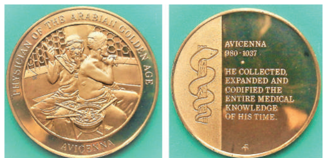
Мал. 5. Авіценна (Ібн-Сіна). Медаль, США.

У згаданій американській серії «Історія медицини в медалях» є настільна медаль (мал. 5), присвячена цій видатній особистості (Ø 39 мм, бронза). У центрі аверсу зображено Авіценну, який лікує хворого, а по краю колом зверху напис англійською мовою: «PHYSICIAN OF ARABIAN GOLDEN AGE» (ЛІКАР АРАБСЬКОЇ ЗОЛОТОЇ ДОБИ), знизу «AVICENNA». Ліву третину реверсу прикрашає вигравірована медична емблема – змія, що обвиває посох Асклепія. Решту медального поля займає дев'ятирядковий напис: «AVICENNA / 980-1037 // HE COLLECTED, / EXPANDED AND / CODIFIED THE / ENTIRE MEDICAL / KNOWLEDGE / OF HIS TIME.» (АВІЦЕННА / 980-1037 // ВІН ЗІБРАВ, / РОЗШИРИВ ТА / КОДИФІКУВАВ / УСІ МЕДИЧНІ / ЗНАННЯ / СВОГО ЧАСУ).