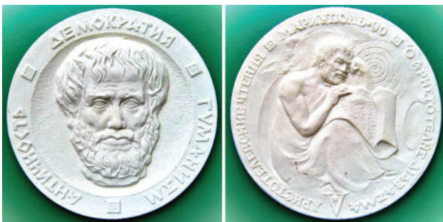
Мал. 3. Аристотель. Українська медаль.

Головний в анфас портрет Аристотеля прикрашає аверс (мал. 3) української медалі (Ø 165 мм, бісквіт, що є різновидом кераміки, автор – Ю. Харабет), створеної до V Аристотелівських читань 1990 р. в Маріуполі. По краю аверсу напис російською мовою: «ДЕМОКРАТИЯ · ГУМАНИЗМ · АНТИЧНОСТЬ» (ДЕМОКРАТИЯ · ГУМАНИЗМ · АНТИЧНІСТЬ). У центрі реверсу – Аристотель, який сидить і на сувої робить напис грецькою мовою, наведений скульптором по краю реверсу російською та грецькою мовами: «V АРИСТОТЕЛЕВСКИЕ ЧТЕНИЯ МАРИУПОЛЬ 90 Ο ΑΡΗΣΤΟΤΕΛΗΣ ΔΙΑΒΑΖΜΑ» (V АРИСТОТЕЛІВСЬКІ ЧИТАННЯ 1990 РОКУ В МАРИУПОЛІ).