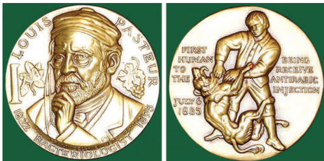
Мал. 12. Луї Пастер. Медаль, США.

У 1989 р. ПМД виготовив медаль (Ø 71 мм, бронза, автор – Coeffin, Франція), присвячену вакцинації людини проти сказу (мал. 13). Погрудний, повернений на три чверті праворуч портрет ученого, який тримає в правій руці та розглядає банку зі спинним мозком кроля, зараженого сказом, який він використовував для розробки вакцини проти сказу, займає більшу частину аверсу. Ліворуч і праворуч напис французькою мовою: «VACCINATION HUMAINE / CONTRE LA RAGE» (ВАКЦИНАЦІЯ ЛЮДИНИ ПРОТИ СКАЗУ). Для створення зображення автор меда-