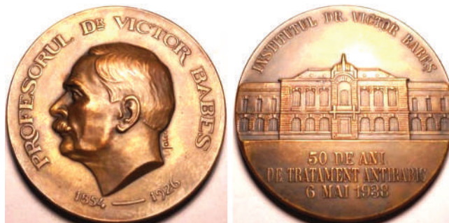
Мал. 26. Віктор Бабеш. Медаль, Румунія.