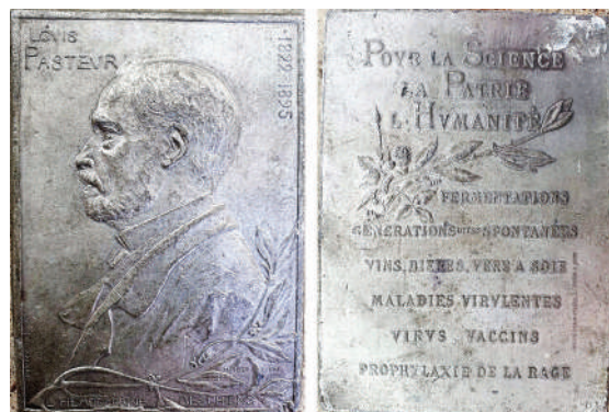
Мал. 16. Луї Пастер. Плакета, Франція.

ТАННА ФЕРМЕНТАЦІЯ ГЕНЕРАЦІЙ ВИНА, ПИВА, ТУТОВИ ШОВКОПРЯДИ, ВІРУЛЕНТНІСТЬ ЗАХВОРЮВАННЯ, ВІРУСНІ ВАКЦИНИ, ПРОФІЛАКТИКА СКАЗУ) [22].