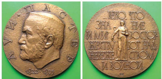
Мал. 20. Луї Пастер. Медаль колишнього СРСР.

На аверсі (мал. 20) розміщено профільне, повернене ліворуч портретне зображення вченого. По краю медального поля, по колу напис: «ЛУИ ПАСТЕР». Під зображенням – дати народження та смерті вченого: «1822 1895». У центрі реверсу – постать богині Гігієї, що знаходиться посередині напису в шість рядків, вислову великого вченого Луї Пастера: «... ВЕРЮ, ЧТО / ЗНАНИЕ / И МИР ВОСТОР- / ЖЕСТВУЮТ НАД / НЕВЕЖЕСТВОМ / И ВОЙНОЙ» (... ВІРЮ, ЩО ЗНАННЯ ТА МИР ПЕРЕМОЖУТЬ НЕВІГЛАСТВО ТА ВІЙНУ). Так, саме з НЕВІГЛАСТВОМ та ВІЙНОЮ зіштовхнулася Україна 2022 р. Але ЗНАННЯ ТА МИР переможуть.