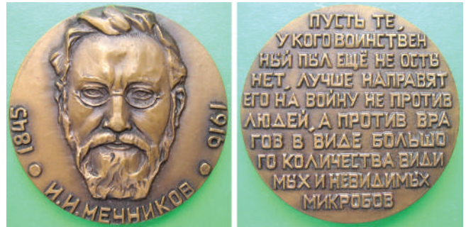
Мал. 23. Ілля Мечников. Медаль колишнього СРСР.

Скульптор Володимир Кербель створив у часи СРСР медаль (Ø 60 мм, томпак, ЛМД) на честь 125-річчя з дня народження цього видатного біолога, одного із засновників еволюційної ембріології, порівняльної патології, мікробіології та імунології, почесного члена Петербурзької Академії наук (мал. 23). Майже все медальне поле аверсу займає головний (анфас) портрет вченого. Кругло знизу дати народження і смерті : «1845-1916» та напис: «И. И. МЕЧНИКОВ». На реверсі медалі подано оригінальний пацифістський вислів вченого, який дуже актуальний сьогодні для України, що потерпає від російської агресії : «ПУСТЬ ТЕ, / У КОГО ВОИНСТВЕН / НЫЙ ПЫЛ ЕЩЕ НЕ ОСТЫ / НЕТ, ЛУЧШЕ НАПРАВЯТ / ЕГО НЕ НА ВОЙНУ ПРОТИВ / ЛЮДЕЙ, А ПРОТИВ ВРА / ГОВ В ВИДЕ БОЛЬШО / ГО КОЛИЧЕСТВА ВИДИ / МЫХ И НЕВИДИМЫХ / МИКРОБОВ» (НЕХАЙ ТІ, У КОГО ВОЙОВНИЧИЙ ПИЛ ЩЕ НЕ ОХОЛОНЕ, КРАЩЕ СПРЯМУЮТЬ ЙОГО НЕ НА ВІЙНУ ПРОТИ ЛЮДЕЙ, А ПРОТИ ВОРОГІВ У ВИГЛЯДІ ВЕЛИКОЇ КІЛЬКОСТІ ВИДИМИХ І НЕВИДИМИХ МІКРОБІВ).