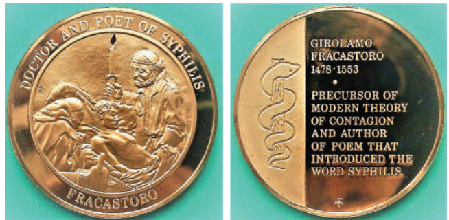
Мал. 7. Джироламо Фракасторо. Медаль, США.

У серії «Історія медицини в медалях» була і медаль (Ø 39 мм, бронза), присвячена Джироламо Фракасторо (мал. 7). Центральна частина аверсу – зображення лікаря, який оглядає хворого, тримаючи свічу в правій руці. По краю аверсу, по колу, зверху напис англійською мовою: «DOCTOR AND POET OF SYPHILIS» (ДОКТОР ТА АВТОР ПОЕМИ ПРО СИФІЛІС), знизу «FRACASTORO». Ліву третину реверсу прикрашає вигравірувана медична емблема – змія, що обвиває посох Асклепія. Решту медального поля реверсу займає напис із одинадцяти рядків: «GIROLAMO / FRACASTORO / 1478-1553 // PRECURSOR OF / MODERN THEORY / OF CONTAGION / AND AUTHOR / OF POEM THAT / INTRODUCED THE / WORD SYPHILIS» (ДЖИРОЛАМО / ФРАКАСТОРО / 1478-1553 // ПОПЕРЕДНИК / СУЧАСНОЇ ТЕОРІЇ / ЗАРАЗНИХ ХВОРОБ / І АВТОР / ПОЕМИ, ЯКА / ВВОДИТЬ СЛОВО СИФІЛІС). Треба зазначити, що Фракасторо не тільки ввів термін сифіліс, а й описав у поетичній формі, але не відмовляючись від точності, симптоми цієї хвороби та ліки від неї.