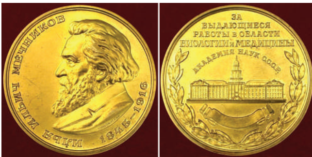
Мал. 22. Ілля Мечников. Нагородна медаль АН СРСР.

Скульптор Володимир Кербель створив у часи СРСР медаль (Ø 60 мм, томпак, ЛМД) на честь 125-річчя з дня народження цього видатного біолога, одного із засновників еволюційної ембріології, порівняльної патології, мікробіології та імунології, почесного члена Петербурзької Академії наук (мал. 23). Майже все медальне поле аверсу займає головний (анфас) портрет вченого. Кругло знизу дати народження і смерті : «1845-1916» та напис: «И. И. МЕЧНИКОВ». На реверсі медалі подано оригінальний пацифістський вислів вченого, який дуже актуальний сьогодні для України, що потерпає від російської агресії : «ПУСТЬ ТЕ, / У КОГО ВОИНСТВЕН / НЫЙ ПЫЛ ЕЩЕ НЕ ОСТЫ / НЕТ, ЛУЧШЕ НАПРАВЯТ / ЕГО НЕ НА ВОЙНУ ПРОТИВ / ЛЮДЕЙ, А ПРОТИВ ВРА / ГОВ В ВИДЕ БОЛЬШО / ГО КОЛИЧЕСТВА ВИДИ / МЫХ И НЕВИДИМЫХ / МИКРОБОВ» (НЕХАЙ ТІ, У КОГО ВОЙОВНИЧИЙ ПИЛ ЩЕ НЕ ОХОЛОНЕ, КРАЩЕ СПРЯМУЮТЬ ЙОГО НЕ НА ВІЙНУ ПРОТИ ЛЮДЕЙ, А ПРОТИ ВОРОГІВ У ВИГЛЯДІ ВЕЛИКОЇ КІЛЬКОСТІ ВИДИМИХ І НЕВИДИМИХ МІКРОБІВ).