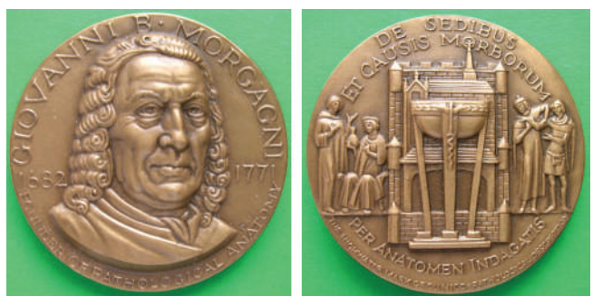
Мал. 8. Д.Б. Морганьї. Медаль, США (автор – А. Belskie).

Дві американські медалі присвячені Д.Б. Морганьї. У 1970 р. була створена високомистецька медаль (мал. 8), присвячена цьому медику (Ø 44 мм, бронза, автор – А. Belskie). Профільний, погрудний, повернений на \frac{3}{4} праворуч портрет лікаря займає центральну частину аверсу. Ліворуч і праворуч – дати його життя: «1682-1771». По краю, кружно, напис зверху: «GIOVANNI B MORGAGNI», знизу: «FOUNDER OF PATHOLOGICAL ANATOMY» (ЗАСНОВНИК ПАТОЛОГІЧНОЇ АНАТОМІЇ). Реверс: в центрі, на тлі будівлі лампа, як символ знань, ліворуч і праворуч двофігурні композиції – лікар і хворий. По краю, кружно, дворядкові написи латиною та англійською мовою, зверху: «DE SEDIBUS / ET CAUSIS MORBORUM», знизу: «PER ANATOMEN INDAGATIS / THE HIGHWATER MARK OF CLINICO-PATHOLOGICAL DESCRIPTION» (МІСЦЯ І ПРИЧИНИ ЗАХВОРЮВАНЬ, ДОСЛІДЖЕНІ АНАТОМІЄЮ), (ВИСОКА МІРКА КЛІНІКО-ПАТОЛОГІЧНОГО ОПИСУ). «МІСЦЯ І ПРИЧИНИ...» – одна з основних наукових праць Морганьї.