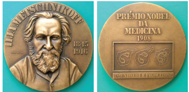
Мал. 24. Ілля Мечников. Медаль, Португалія.

У 70-80-х роках ХХ сторіччя Монетний двір Португалії відкарбував серію медалей, присвячених лауреатам Нобелівської премії з фізіології та медицини. Серед них була і медаль Мечникова (Ø 70 мм, бронза, автор – Cabral Antunes). Погрудний анфас портрет ученого розташовано в центрі аверсу (мал. 24). Зверху кругло напис: «ILJAMETSCHNIKOFF» (ІЛЛЯ МЕЧНИКОВ). Праворуч від портрета горизонтально, двома рядками дати життя : «1845 / 1916». У верхній частині реверсу чотирирядковий напис португальською мовою: «PRÉMIO NOBEL / DA / MEDICINA / 1908» (НОБЕЛІВСЬКА ПРЕМІЯ З МЕДИЦИНИ 1908). Нижче – зображення, що ілюструє стадії фагоцитозу, під яким напис португальською мовою: «IMUNIDADE E FAGOCITOSE» (ІМУНІТЕТ І ФАГОЦИТОЗ).