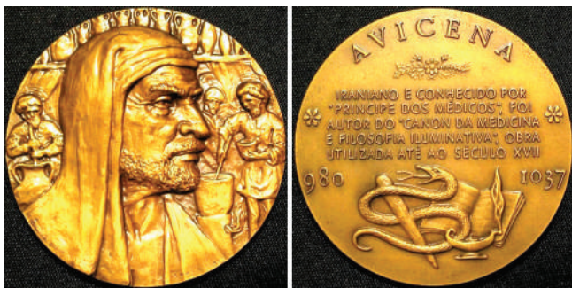
Мал. 6. Авіценна (Ібн-Сіна). Медаль, Португалія.

бронза, монетний двір Португалії). Портрет розташований на тлі багатофігурної композиції. Можна припустити, що готуються ліки (мал. 6). Ідея реверсу подібна до всіх медалей цієї серії. Вгорі по колу напис: «AVICENA», нижче – рослинний орнамент відділяє п'ятирядковий горизонтальний напис португальською мовою: «IRANIANO E CONHECIDO POR / "PRINCIPE DOS MÉDICOS", FOI / AUTOR DO "CANON DA MEDICINA / E FILOSOFIA ILUMINATIVA", OBRA / UTILIZADA ATÉ AO SÉCULO XVII». (ІРАНЕЦЬ, ВІДОМИЙ ЯК / "ПРИНЦ ЛІКАРІВ", БУВ / АВТОРОМ "КАНОНУ МЕДИЦИНИ / ТА ПРОСЯТЛИВОЇ ФІЛОСОФІЇ", ТВОРУ / ЩО ВИКОРИСТОВУВАВСЯ ДО 17 СТ.). У нижній частині реверсу на тлі розкритої книги зображено медичну емблему – змія, яка обвила посох Асклепія, і палаюча лампа, як символ знань. Ліворуч і праворуч – дати життя Авіценни – 980 і 1037 рр.