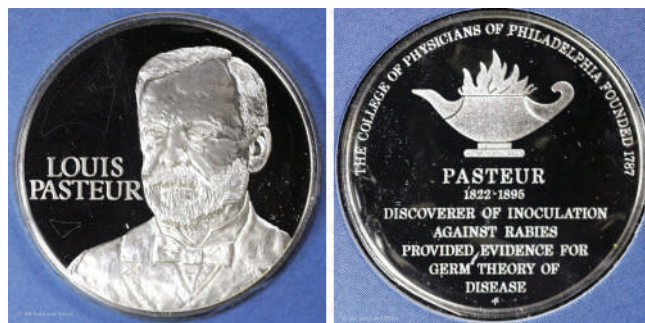
Мал. 17. Луї Пастер. Медаль, США.

Ще одна американська медаль (Ø 39 мм, срібло 925 проби, Franklin mint, 1977) була створена на замовлення Коледжу лікарів Філадельфії до 150-річчя Луї Пастера. На аверсі (мал. 17) показано трохи зміщений праворуч погрудний, повернений на три чверті ліворуч портрет Пастера, ліворуч від нього горизонтальний напис у два рядки: «LOUIS / PASTEUR». На реверсі: лампа, що горить (символізує знання), під нею напис у сім рядків: «PASTEUR / 1822-1895 / DISCOVERER OF INOCULATION / AGAINST RABIES / PROVIDED EVIDENCE FOR / GERM THEORY OF / DISEASE» (ПАСТЕР 1822-1895 ПЕРШО-ВІДКРИВАЧ ВАКЦИНАЦІЇ ПРОТИ СКАЗУ НАДАВ ДОКАЗИ МІКРОБНОЇ ТЕОРІЇ ХВОРОБИ), зверху, по краю, напис: «THE COLLEGE OF PHYSICIANS OF PHILADELPHIA FOUNDED 1787» (КОЛЕДЖ ЛІКАРІВ ФІЛАДЕЛЬФІЇ ЗАСНОВАНО 1787 року).