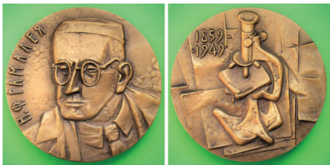
Мал. 25. Микола Ф. Гамалія. Медаль колишнього СРСР.

ника і, нарешті, збігаються з віковими особливостями образу. Напівпогрудний, на \frac{3}{4} обернений ліворуч портрет вченого займає майже все медальне поле. Ліворуч, по краю, кружно напис: «Н.Ф. Гамалея». У центрі реверсу, на тлі зошитів, рукописів, надрукованих наукових праць вченого розміщене зображення тогочасного мікроскопа, яким вчений користувався для своїх досліджень і відкриттів. Зверху, ліворуч, подано дати його народження і смерті: «1859-1949».