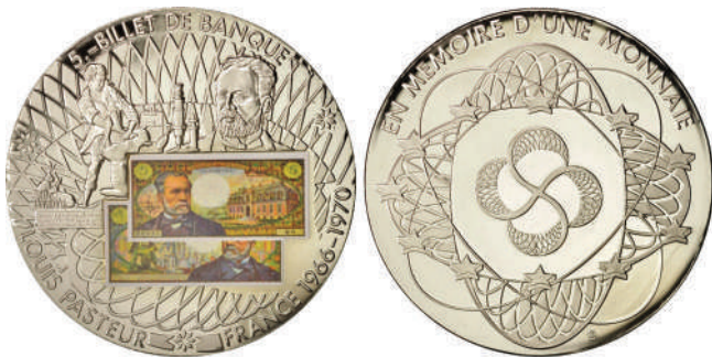
Мал. 11. Французька медаль, присвячена банкноті 5 франків.

вченого займає більшу частину аверсу медалі (мал. 12). Праворуч від портрета – виноградне гроно, ліворуч – листя шовковиці, яке поїдають шовковичні черв'яки. По краю медального поля, по колу, напис зверху: «LOUIS PASTEUR», знизу: «1822 BACTERIOLOGIST 1895» (1822 БАКТЕРІОЛОГ 1895). Ліворуч, між написами – мірна склянка. У центрі реверсу медалі зображення хлопчика, Йозефа Мейстера, який бореться із скаженим собакою. Зображення ділить на дві частини горизонтальний напис із семи рядків англійською мовою: «FIRST / HUMAN / BEING / TO RECEIVE / THE ANTIRABIC / INJECTION / JULY 6 / 1885» (ПЕРША ЛЮДИНА, ЯКА ОТРИМАЛА ІН'ЄКЦІЮ ПРОТИ СКАЗУ). Можна вважати, що зображення символізує також боротьбу людини проти сказу.