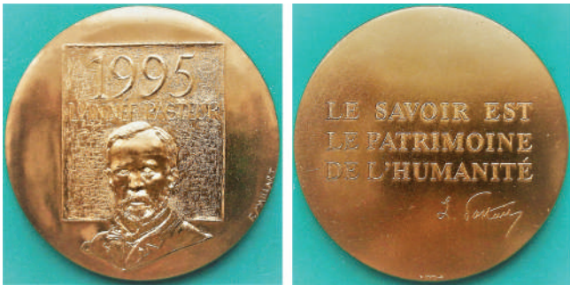
Мал. 18. Французька медаль «Рік Пастера».

тувати інформацію [23], що ця медаль є офіційною нагородою Французької Академії. У нижній частині аверсу (мал. 18), на тлі прямокутника з написом «1995 / L'ANNÉE PASTEUR» (1995 РІК ПАСТЕРА) погрудний в анфас портрет ученого. У середній частині реверсу трирядковий напис: «LE SAVOIR EST / LE PATRIMOINE / DE L'HUMANITÉ» (ЗНАННЯ – СПАДОК ЛЮДСТВА), нижче – підпис Пастера.