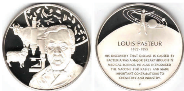
Мал. 15. Луї Пастер. Медаль, США.

Ще одна французька плакета (111 мм × 81 мм, алюміній, автор – V.S-Canale) була присвячена пам'яті Пастера. Аверс (мал. 16): поясний, профільний, повернений ліворуч портрет вченого, написи, ліворуч зверху в два рядки, горизонтально – «LOUIS / PASTEUR», праворуч зверху вертикально – «1822-1895», знизу, між гілками лавра – «OFFERT PAR L'HEMOGLOBINE DESCHIENS» (ЗАМОВЛЕННЯ Л'HEMOGLOBINE DESCHIENS). Реверс текстовий: зверху напис у три рядки – «POVR LA SCIENCE / LA PATRIE / L'HYMANITÉ» (ДЛЯ НАУКИ БАТЬКІВЩИНИ ЛЮДСТВА), нижче гілка лавру, під нею напис у шість рядків – «FERMENTATIONS / GENERATIONS DITES SPONTANÉES / VINS, BIÉRES, VERS A SOIE / MALADIES VIRVLENTES / VIRVS VACCINS / PROPHELAXIE DE RAGE» (ТАК ЗВАНА СПОН-