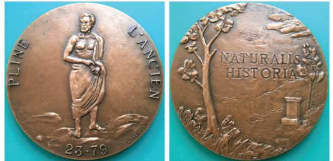
Мал. 4. Пліній Старший. Французька медаль.

Плінію Старшому присвячено медаль французького скульптора J. Costanzo (Ø 68 мм, бронза, ПМД, 1979). Портрет Плінія у весь зріст займає центральну частину аверсу (мал. 4). Ліворуч і праворуч кружний напис по краю: «PLINE L'ANCIEN» (ПЛІНІЙ СТАРШИЙ). Під портретом роки життя письменника та натураліста: «23-79». Реверс – зображення пейзажу з постаментом, над яким дворядковий напис, назва відомої праці Плінія: «NATURALIS / HISTORIA» (ПРИРОДНИЧА / ІСТОРІЯ). Зверху й знизу вгадуються контури птаха та тварини.