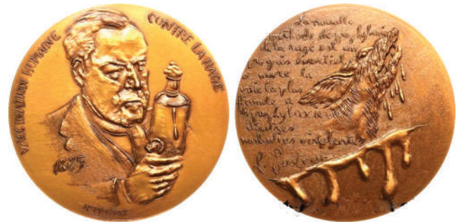
Мал. 13. Французька медаль, присвячена вакцинації проти сказу.

лі використав картину, що зображає Пастера в його лабораторії (Albert Edelfelt, 1885). Реверс: трохи зміщене праворуч зображення голови скаженого собаки з піною з рота, ліворуч одинадцятирядковий напис французькою мовою, вислів Пастера: «LA NOUVELLE / MÉTHODE DE PROPHYLAXIE / DE LA RAGE EST UN / PROGRÈS ESSENTIEL / ET OUVRE LA / VOIE LA PLUS / FÉCONDE A / LA PROPHYLAXIE / D'AUTRES / MALADIES VIRULENTES / L. PASTEUR.» (НОВИЙ МЕТОД ПРОФІЛАКТИКИ СКАЗУ Є ІСТОТНИМ ПРОГРЕСОМ І ВІДКРИВАЄ НАЙБІЛЬШ ПЛІДНИЙ ШЛЯХ ДО ПРОФІЛАКТИКИ ІНШИХ ВІРУЛЕНТНИХ ХВОРОБ Л. ПАСТЕР). В нижній частині медалі слина скаженого собаки [21].