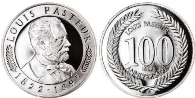
Мал. 19. Луї Пастер. Медаль, США.

Цього ж року була викарбувана в США більш розповсюджена медаль (Ø 34 мм, срібло 925 проби, The Franklin mint). Середню частину її аверсу (мал. 19) займає профільний, погрудний, повернений праворуч портрет ученого, по краю зверху напис: «LOUIS PASTEUR» (ЛУІ ПАСТЕР), знизу: «1822-1895». Між написами – лаврові гілки. По краю реверсу – переплетені лаврові гілки, в центрі напис у чотири рядки: «LOUIS PASTEUR / 100 / IÈME / ANNIVERSAIRE» (100-РІЧЧЯ ЛУІ ПАСТЕРА) [24]