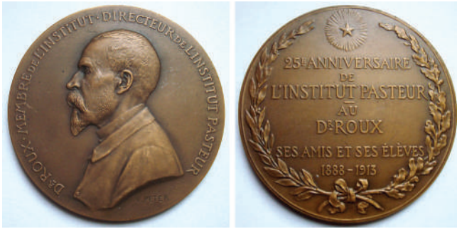
Мал. 21. Еміль Ру. Французька медаль.

/ РАБОТЫ В ОБЛАСТИ / БИОЛОГИИ И МЕДИЦИНЫ» (ЗА ВИДАТНІ РОБОТИ В ГАЛУЗІ БІОЛОГІЇ ТА МЕДИЦИНИ). Нижче овальний напис: «АКАДЕМІЯ НАУК СРСР», ще нижче – зображення будівлі Академії наук СРСР, урочиста стрічка. По краю – переплетені гілки лавра.