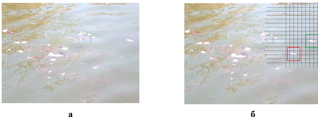
Рис. 3. Пример возможного несовпадения сеток разбиения области клонирования и прообраза: а – оригинальное ЦИ; б – ЦИ, подвергнутое обработке

Замечание. Для того, чтобы предлагаемый метод обеспечивал чувствительность к нарушению целостности, охватывающему ЦИ целиком (наложение шума, сжатие с потерями, фильтрация ЦИ), погружение элементов K на шаге 3.3 организации СП должно происходить неустойчивым к возмущающим воздействиям стеганоалгоритмом. Для организации выявления областей нарушений целостности, происходящих на ЦИ локально (области локально проведенных геометрических атак, в частности, клонирования), алгоритм погружения элементов K должен быть устойчивым к атакам против встроенного сообщения. В этом случае разработанный метод позволит отделять область клона от прообраза при имеющем место клонировании и в условиях отсутствия какой-либо постобработки области клона; кроме того с учетом предложенной организации СП, клонирование будет выявляться и в случае сохранения измененного ЦИ с потерями, что, как можно судить по источникам, доступным из открытой печати, не делалось ранее.