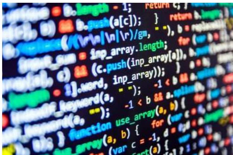
Рис. 2. Вигляд коду веб-ресурсу

Можна говорити про те, що людина яка керується грошима, може створити такі ресурси та обманювати інших людей тому, що один чоловік який може створити декілька таких ресурсів може заподіяти дуже велику шкоду, та щоб знайти його, потрібно докласти багато зусиль так як самі Люди створюють програмне забезпечення яке захищає їх від пливучих інформаційних технологій, тобто для того щоб знайти людину яка відправила повідомлення потрібно дуже багато зусиль, хоча в більшості випадків таку людину знайти неможливо тому процвітає інтернет шахрайство та інформація приховується навіть від професійних шукачів злочинців.