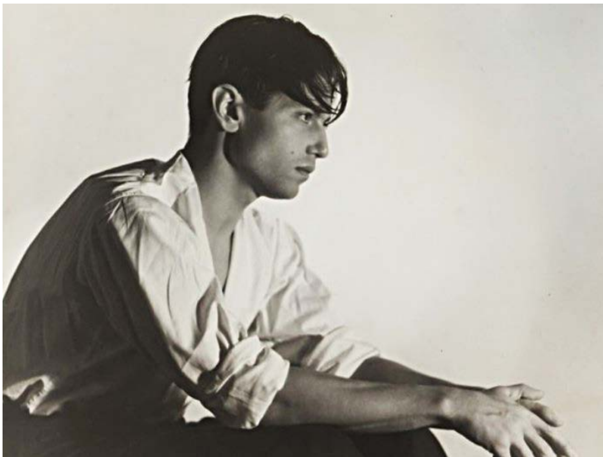
Іл. 11. Серж Лифар

багатьох театрах України, органічно поєднував у своїх виставах балетну класику з модерном і фольклорними мотивами. Упродовж 1926–1928 рр. він очолював Одеський театр опери і балету, який під його керівництвом перетворився на балетний Голівуд і фабрику нового танцю 3 . У балеті «Йосип Прекрасний» С. Василенка за біблійною легендою Голейзовський застосував багаторівневі конструкції в оформленні сцени, що дали можливість показати людську постать об'ємно, чому також значною мірою сприяли мінімалістичні стилізовані костюми й виразний грим виконавців. Голейзовський з насолодою втілював свої ідеї в танцювальних композиціях, використовуючи красу людського тіла як скульптурний матеріал. Радянська влада критикувала постановки Голейзовського за формалізм і «нездорову еротіку». У театрах України балетмейстер поставив балети «Смерч» Б. Бера, «У сонячних променях», «Йосип Прекрасний» С. Василенка та багато інших хореографічних творів. У