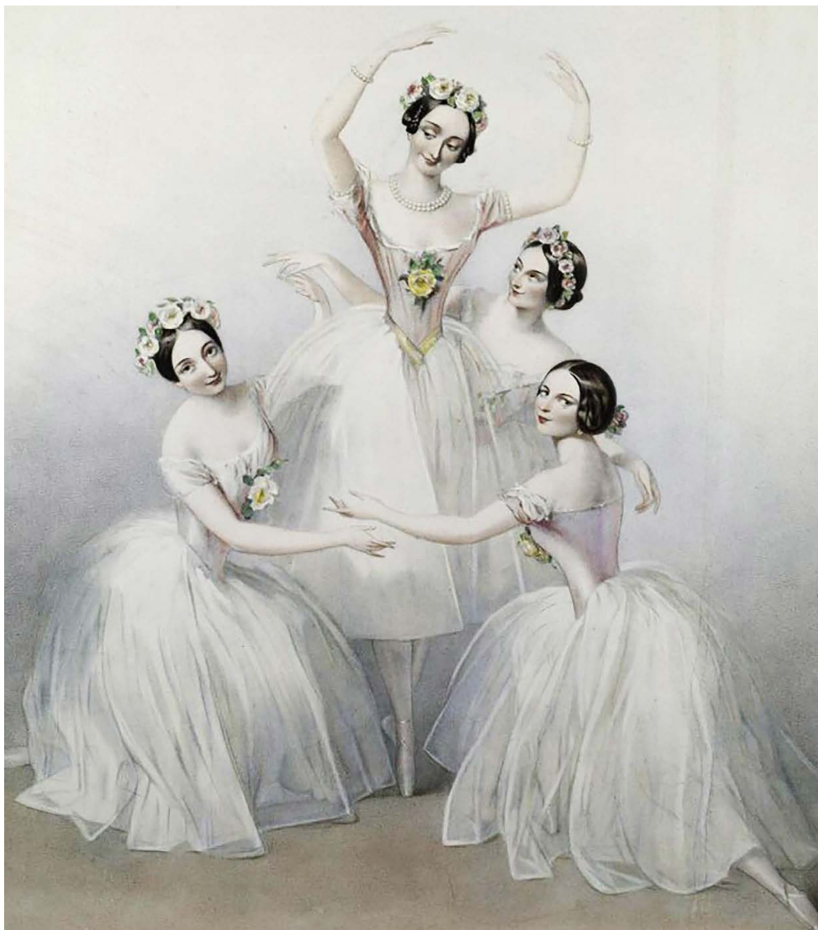
Гл. 1. «Па-де-катр» Ц. Пуні. Хореографія Ж. Перро. Виконують К. Грізі, М. Тальоні, Ф. Черріто та Л. Гран

ною реконструкцією тих епох, коли професія зароджувалася. Так, в епоху Відродження і навіть у пізньому Середньовіччі є згадки про так званий «вчений танець», тобто танець, який потребує продуманої композиції і спеціального тренування для вдосконалювання виконання. В епоху Відродження з'являються трактати, присвячені мистецтву танцю — бальним танцям і балетам. Найбільш відо-