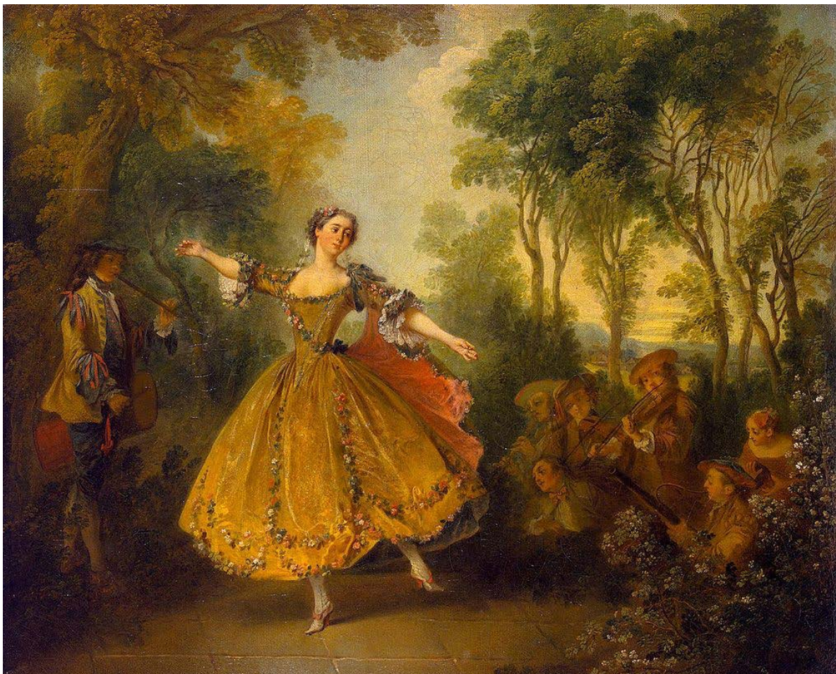
Іл. 3. Марі Камарго. Картина Н. Ланкре

танцювали їх граційно й пристрасно, тамбури-ни, тому що в цьому жанрі відзначалася м-ль Камарго, і, насамкінець, шаконну й пассакайл (чакону й пассакалію — Є. К.), оскільки знаменитий Дюпре був наче прикований до цих рухів, що відповідали його смаку, жанру та шляхетності його постаті» (Noverre, 1760).