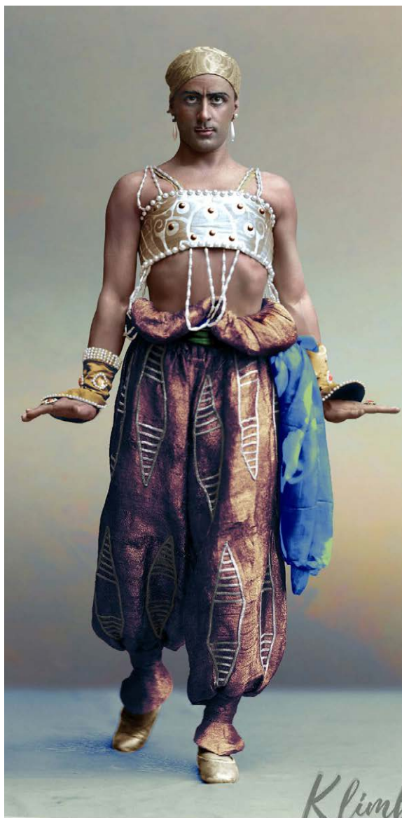
Іл. 4. Михайло Фокін – Золотий Раб у балеті «Шехерезада» О. Римського-Корсакова

Так, одним з кращих учнів Новера був Жан Доберваль, який увійшов в історію як автор балету «Марна пересторога» (оригінальна назва «Балет про солону, або Погано збережена донька»). Жан Доберваль також поставив балет «Дезертир», де наголошував на проблемі примушення селян-