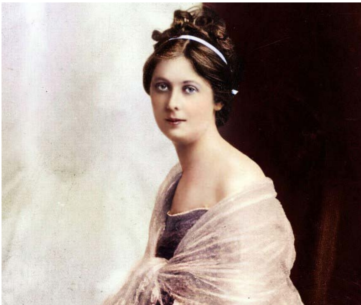
Лл. 8. Айседора Дункан

шедеври балетної класики, як «Шопеніана», «Видіння троянди» на музику К.-М. Вебера та «Лебідь» К. Сен-Санса, який був створений балетмейстером майже експромтом для А. Павлової і став однією з найвідоміших хореографічних мініатюр у репертуарі багатьох прекрасних балерин.