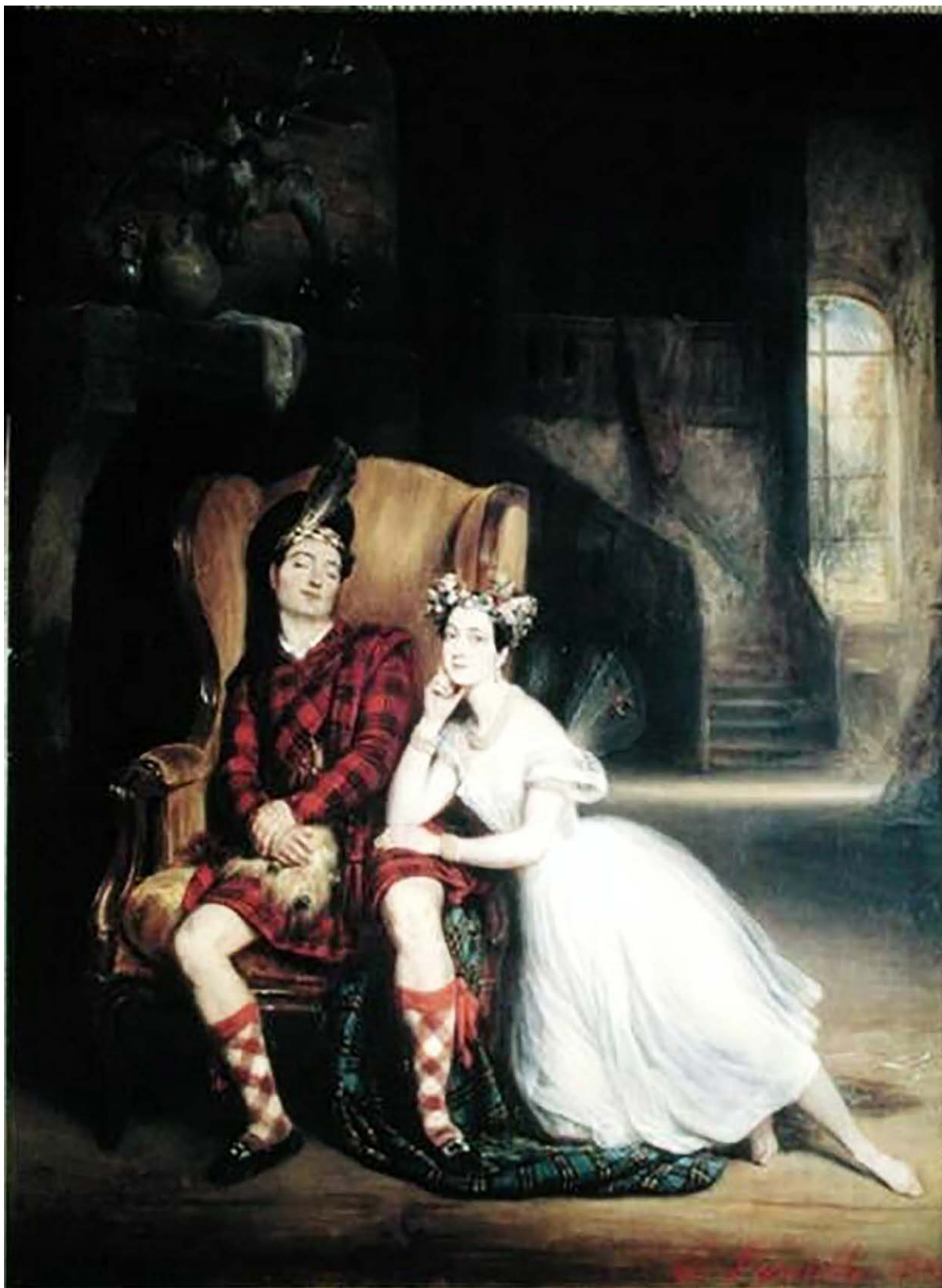
Іл. 5. Марія Тальоні та її брат Поль (Паоло) Тальоні в балеті «Сильфіда». Художник Ф. Леполь (1832)