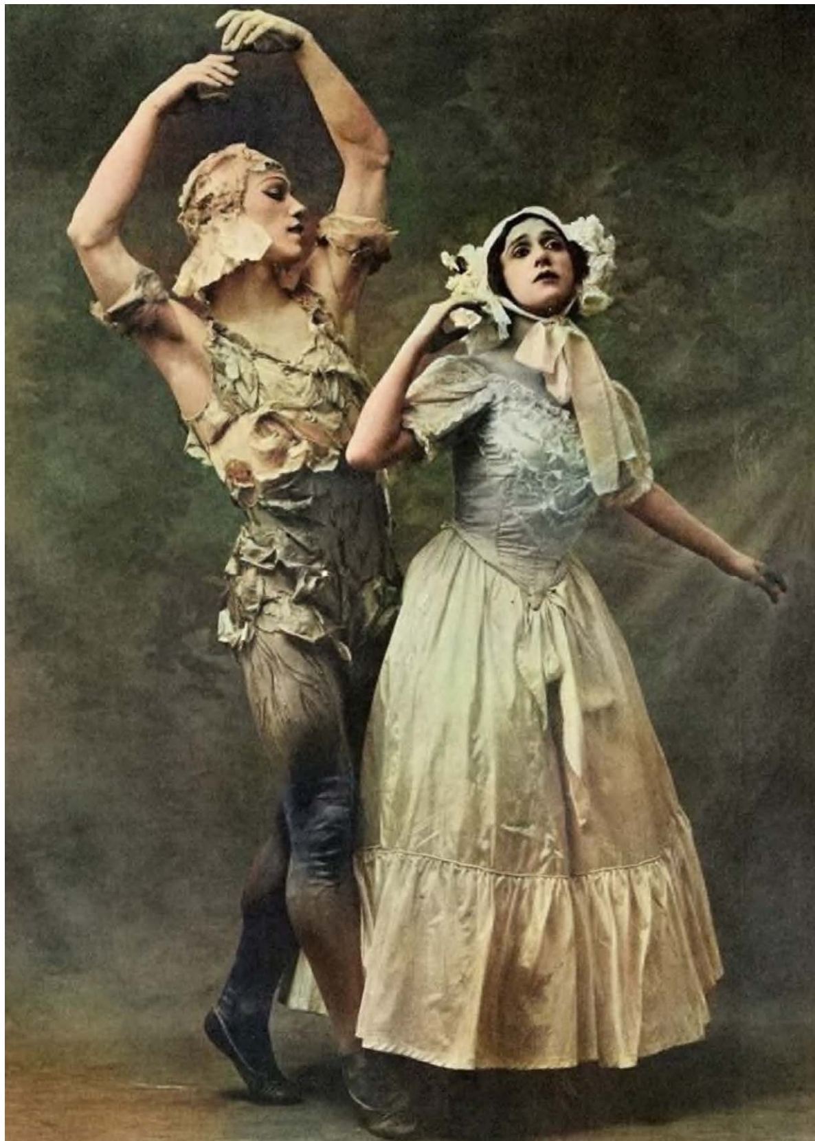
Іл. 9. Т. Карсавіна та В. Ніжинський у балеті на муз. К.-М. Вебера «Видіння Троянди»