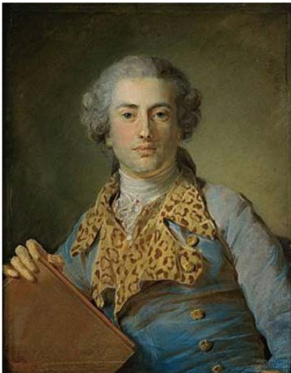
Лл. 2. Жан Жорж Новер

сценічний танець стрибок, подібний до pas de ciseaux en tournant або revolta de en tournant , а про його виконавську манеру один із сучасників писав, що він не був танцівником прекрасної зовнішності, але був наповнений силою й вогнем. «Ніхто не перевершував його в стрімких обертаннях. Ніхто не міг краще, ніж він, примусити танцювати» (Levinson, 1925, р. 52). У той час, коли танцювальні композиції на балах і в балетах були чітко регламентовані, він знаходив дуже оригінальні й ефектні композиційні малюнки. П. Бошан зізнався, що на ці еволюції його надихають голуби, за якими він спостерігає, коли кидає їм крихітки хліба з вікна своєї мансарди.