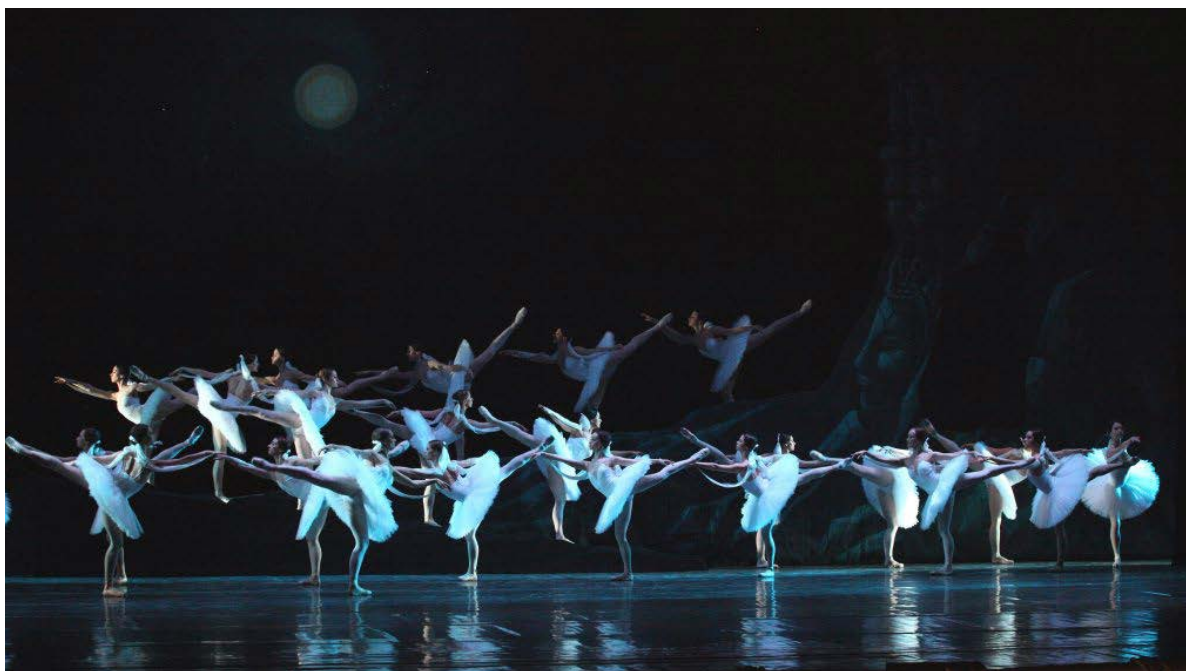
Іл. 7. Сцена з балету Л. Мінкуса «Баядерка»

не драматичній фабулі вистави, а видовищності, сценічним ефектам, танцювальній техніці. Сен-Леон сам був віртуозним танцівником і музикантом-скрипалем. У своєму балеті «Скрипка диявола» він танцював варіацію, акомпануючи собі на скрипці. У своїх балетах Сен-Леон використовував народні танці, які він стилізував для сцени. Наприклад, у фіналі балету «Горбоконики» він поставив цілу сюїту танців різних народів. Тут Сен-Леон прагнув до створення масштабного видовища, яке б звеселяло очі сценічними ефектами, вправністю танцівників у класичних та жанрових номерах. Сен-Леон працював дуже швидко, найкраще йому вдавалися віртуозні варіації. Балетмейстер зробив великий внесок у вдосконалення техніки класичного танцю, формування народно-сценічного танцю. Найкращим твором А. Сен-Леона вважається балет «Коппелія», який був поставлений у Парижі на сцені Гранд-опера 1870 року й названий сучасним американським балетмейстером Баланчиним останнім романтичним балетом. Цей спектакль дуже популярний і ставиться в багатьох театрах світу, а також у хореографічних школах, зокрема в Київському хореографічному училищі (постановки О. Виноградова та В. Малахова). Деякі інші твори А. Сен-Леона увійшли до класичної балетної спадщини та з успіхом ідуть на світових сце-