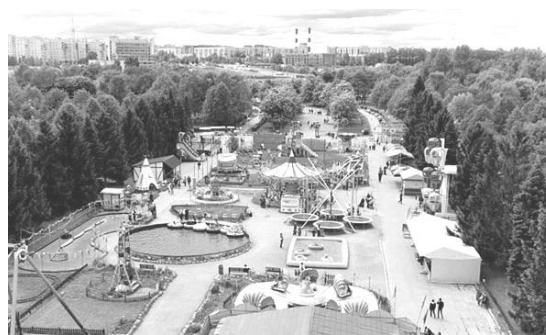
Рис. 7. Парк розваг «Диво-острів» на території Приморського парку