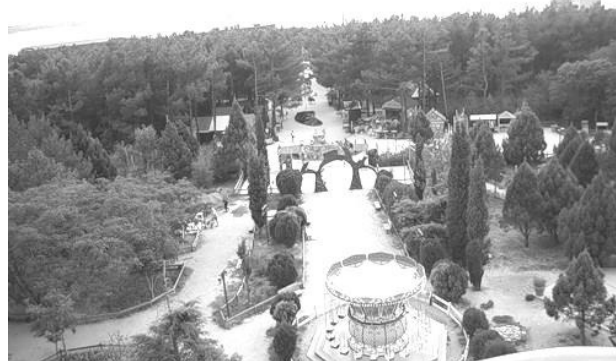
Рис. 6. Парк атракціонів «Адмірал Врунгель» в м. Геленджик

«Диво-острів» відкрився у травні 2003 році на території Приморського парку Перемоги на Крестовському острові (Росія). Парк створювався за принципом комплексності наданих послуг: тут працюють не тільки атракціони провідних фірм, а й сценічні майданчики для проведення концертів та шоу-програм, 5 тематичних кафе, які мають власний індивідуальний стиль, меню [2].