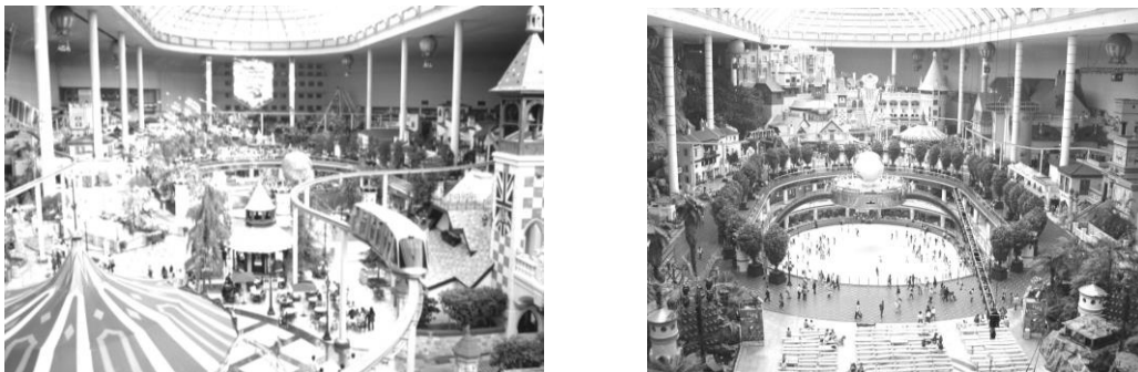
Рис. 4. Критий парк розваг «Lotte World» в Азії

Lotte World – найбільший критий парк розваг у світі, який знаходиться в Азії, талісманами якого є енти Лотті та Лорі – веселі мультиплікаційні герої. Найпопулярніші атракціони парку: «Вільне падіння», «Гойдалки». У критій частині парку «Adventure» відвідувачі здійснюють мандрівку по всім континентам світу і просторам всесвіту. Тут є африканські джунглі, італійські вулиці, єгипетські піраміди [3].