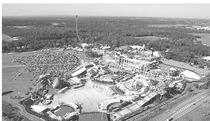
Рис. 2. Парк «Dreamworld» в Австралії

Німецький тематичний парк Europa-Park (1975 р.) – найбільший тематичний парк розваг в Німеччині, який пропонує відвідувачам здійснити мандрівку по 12 тематичним зонам, де вони знайомляться з природою, архітектурою, культурою, стравами європейських країн. Атракціони (100 од.) і шоу-програми інтегровані в тематичні зони парку, які спроектовані з великою увагою до дрібниць [5].