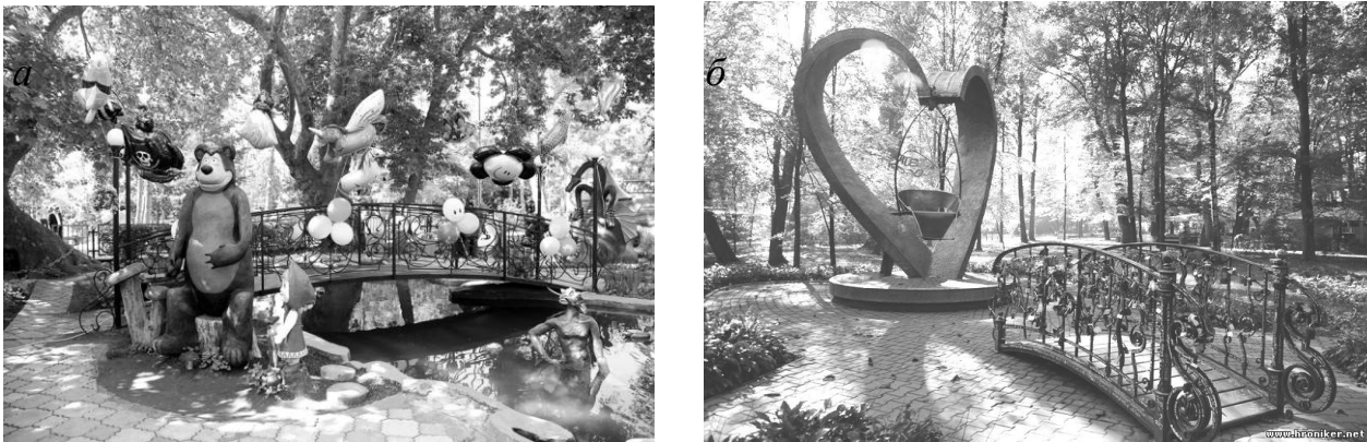
Рис. 8. Парки розваг в Україні: а – приватний парк розваг літнього типу в Євпаторії; б – ЦПКіВ ім. Т. Шевченка в Чернівцях

штаб-квартири Міжнародної асоціації парків і виробників атракціонів у м. Орlando, штат Флориди. Метою його перебування було відвідання парків в Україні та визначення номінанта на нагороду «Європейський золотий поні». Загальна мета цієї нагороди – визначити коло постійно діючих парків відпочинку й розваг, пересувних атракціонів, які успішно працюють в цій сфері. Україна презентувала два парки розваг (рис. 8).