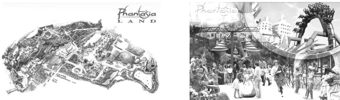
Рис. 5. Парк «PhantasiaLand» (м. Брюль, Німеччина)

Справжня Африка знаходиться у парку «PhantasiaLand» (м. Брюль, Німеччина). Його нова тематична зона Deer in Africa демонструє загадковий світ. На шляху пасажирів зустрічаються водоспади, дикі ліси, змінюється день на ніч. Цікавим є Talosap – атракціон на тему ацтеків, що представляє собою сцену – руїни храму ацтеків, під час катання застосовуються різноманітні ефекти – вогонь, гейзери, димові завіси [4].