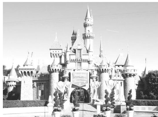
Рис. 1. Парк «Діснейленд» в Анахаймі

Яскравими прикладами тематичних парків розваг, тематика яких відіграє роль своєрідної візитівки, є наступні 4 парки: «Dreamworld» (Австралія); «Europa-Park» (Німеччина); «Lotte World» Азія; «Phantasialand» (Німеччина).