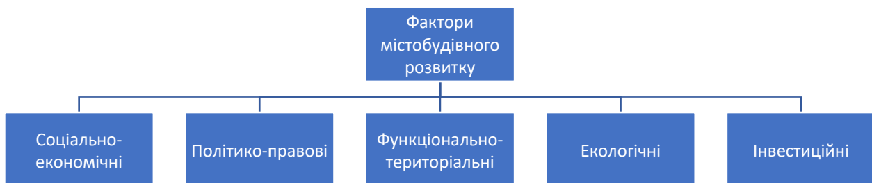
Рис. 1 – Фактори розвитку систем містобудування

Проблеми містобудування на глобальному та національному рівнях визначаються наступними факторами – рис. 1 [11]