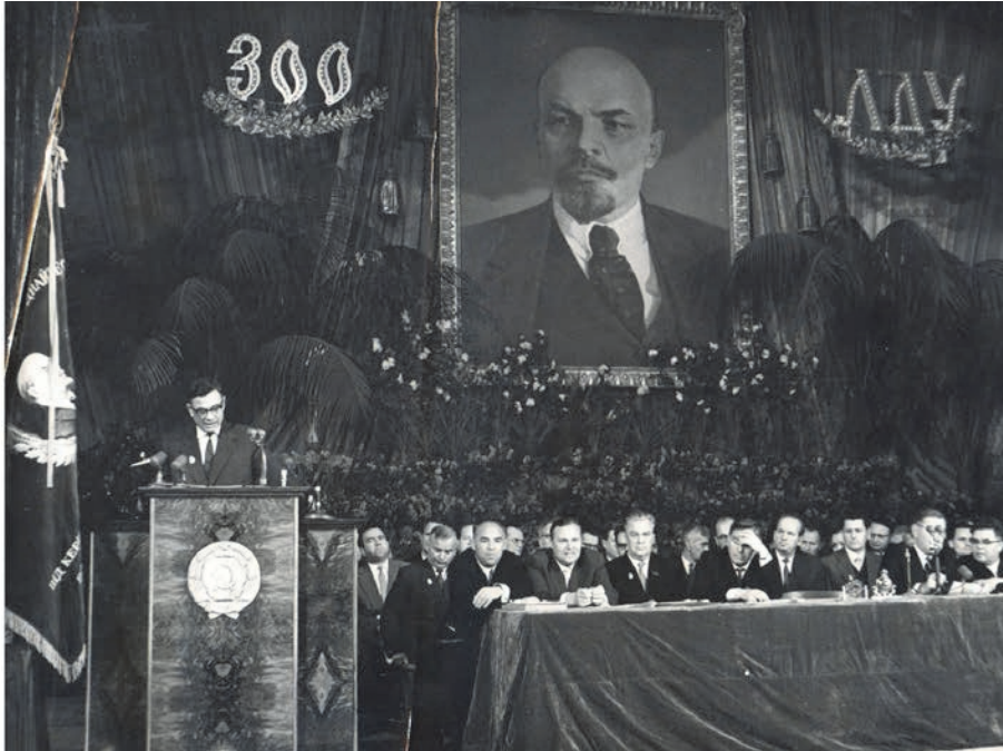
Урочисте засідання з нагоди 300-річчя Львівського університету і нагородження його орденом Леніна. Львівський театр опери і балету, 1961.

У 1956 р. в університеті широко відзначено 100-річчя від дня народження Івана Франка з виїздом у Дрогобич, Нагуєвичі та Криворівню. До цієї дати в с. Криворівня створено музей Івана Франка й організовано меморіальну таблицю при вході в аудиторію 244 на геологічному факультеті (вул. Грушевського, 4). У парку навпроти головного корпусу університету встановлено обеліск, на місці якого 1964 р. споруджено монументальний пам'ятник Іванові Франку.