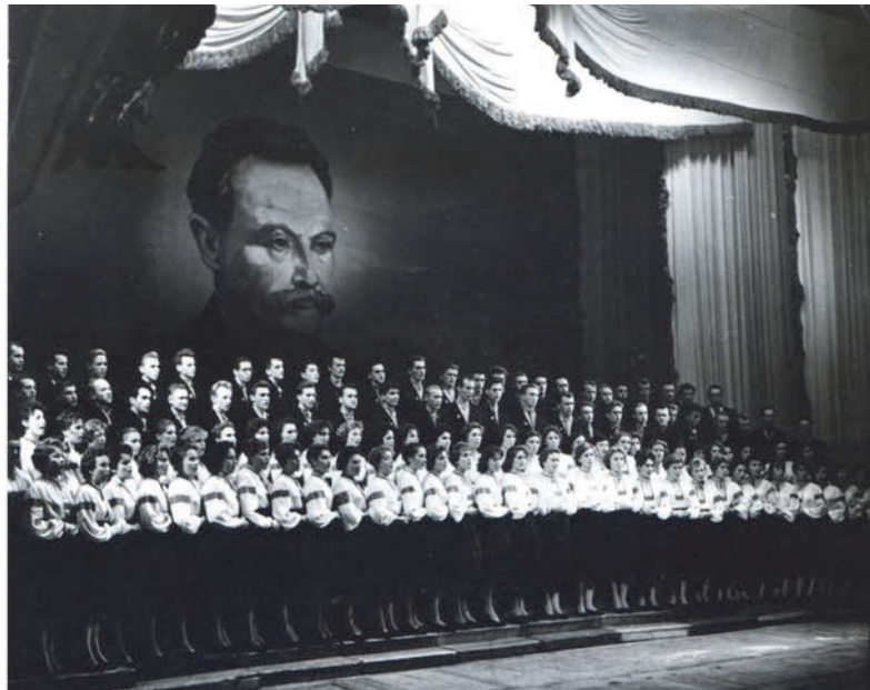
Святковий концерт, присвячений 100-річчю від народження Івана Франка. Львівський театр опери і балету імені Івана Франка, 1956.