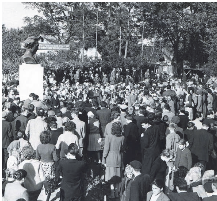
Урочисте відкриття погруддя Маркіяна Шашкевича, с. Підлисса, 1961.