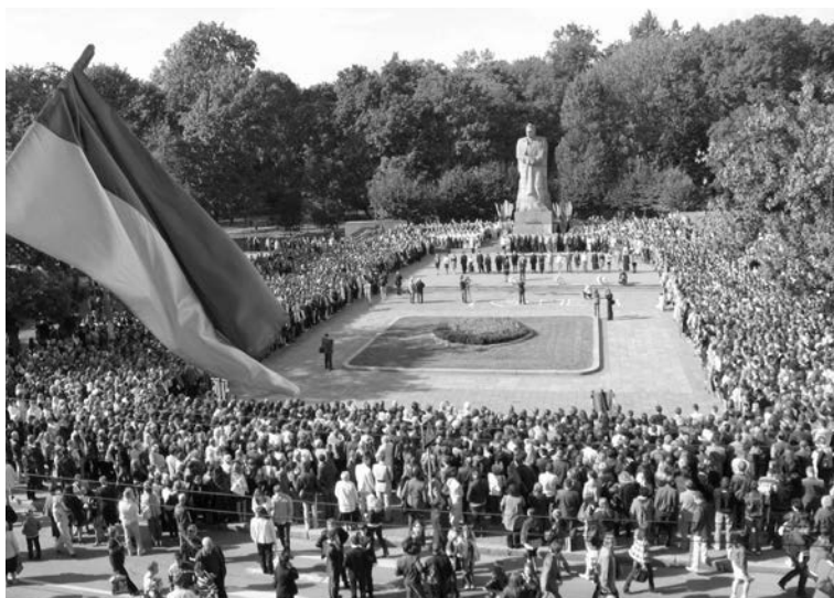
Урочиста посвята в студенти Львівського національного університету імені Івана Франка біля пам'ятника Іванові Франку.

З 300-річчям заснування Львівського університету і високою урядовою нагородою ректора привітали академіки АН СРСР О. Виноградов, М. Лаврент'єв, В. Соколов, академіки АН УРСР Б. Савін, В. Порфир'єв, Б. Гніденко, професор Московського університету М. Єрмаков, професор Ленінградського університету Д. Григор'єв, народні артисти СРСР О. Гай та В. Яременко, перший секретар Львівського обкому партії Я. Погребняк.