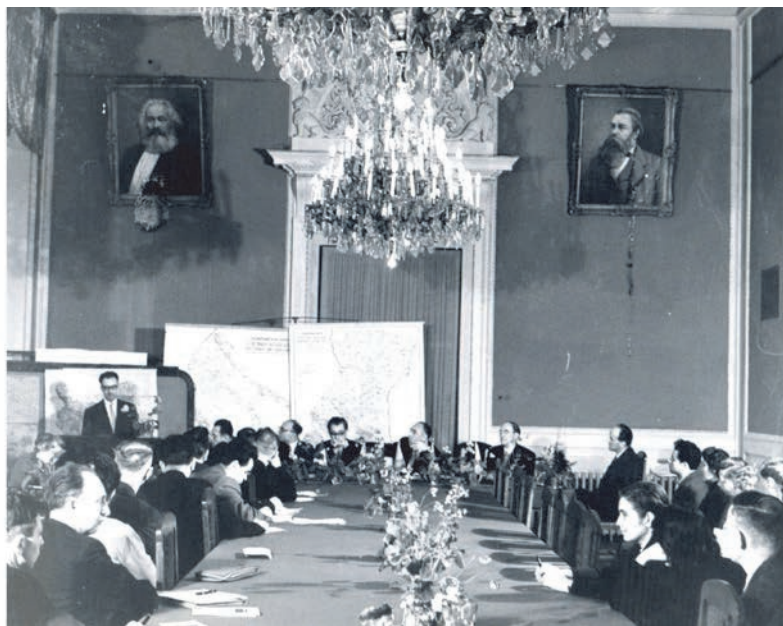
Засідання Комісії мінералогії і геохімії Карпато-Балканської геологічної асоціації. Дзеркальна зала Львівського університету, 1961.