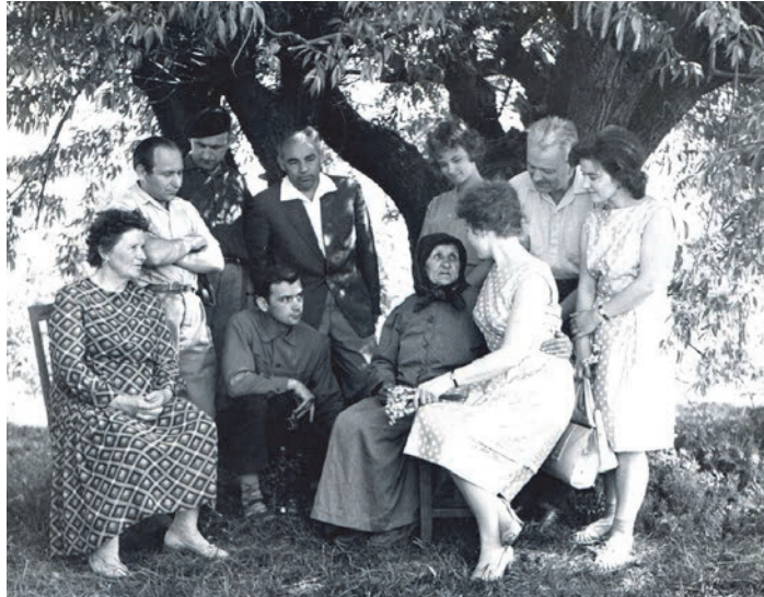
Учасники наукової конференції, с. Колодяжне, 1963.

ліського, Томського, Туркменського та Ужгородського державних університетів, Дніпропетровського гірничого, Дніпропетровського сільськогосподарського, Дрогобицького педагогічного, Київського політехнічного, Львівського політехнічного, Львівського торгово-економічного і Харківського політехнічного інститутів, Львівської державної філармонії, Львівського інституту прикладного і декоративного мистецтва, Одеського інституту інженерів морського флоту, Науково-дослідного інституту землеробства і тваринництва західних районів УРСР, Науково-дослідного інституту педагогіки, Інституту вдосконалення кваліфікації вчителів та Українського поліграфічного інституту.