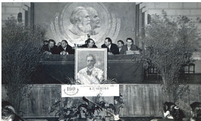
Урочисте засідання, присвячене 100-річчю від народження А. Чехова. Актова зала Львівського університету, 1960.