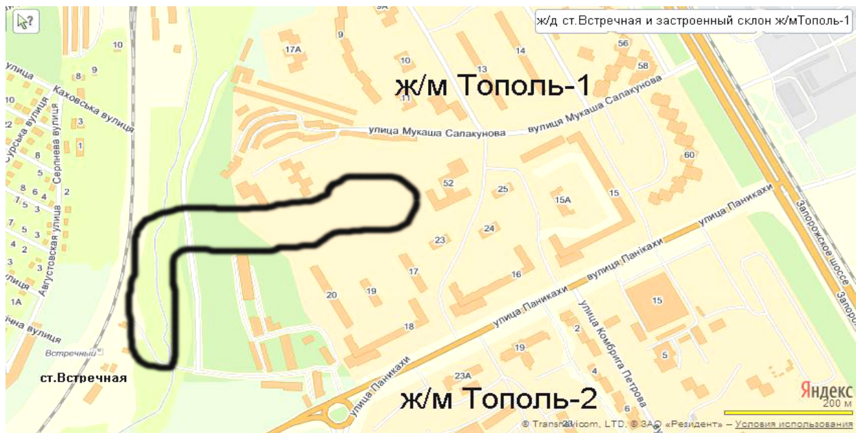
Рис. 1. Границы оползня 1997 года на склоне Встречной балки (ж/м Тополь-1) вблизи ж/д станции Встречная.

Для устройства грунтовой подушки мощностью 3 м разрабатывали и послойно трамбовали местные тяжелые суглинки. Эти 14-ти этажные жилые блоки были сданы в эксплуатацию без необходимых внешних систем инженерной защиты и централизованного отвода ливневых вод. Обильные дожди и весеннее таяние снегов, размывающие суглинки склона вызывали поднятие УГВ. В 1986–87 годах произошли первые аварии. Ниже дома № 60 появились трещины в несущих конструкциях детсада № 15а и двух средних подъездах дома № 15 (рис. 2). Из-за больших деформаций фундаментов и трещин межэтажных конструкций жильцов этих подъездов отселили. Виновными признали руководство «Днепргражданпроекта». Анализ гидрогеологической обстановки на территории ж/м Тополь-1 показывает, что с момента создания микрорайона происходил постоянный подъем УГВ со средней скоростью 0,6 м в год (по другим данным – 0,8 м). Стабилизации подъема не наблюдалось. Если в начале строительства в 1970 году грунтовые воды находились на глубине 19...23 м, то по состоянию на июнь 1997 года – уже на глубине 4...6 м. Объем подземных вод увеличивался за счет утечек из водопровода, из подземных теплотрасс и канализации. В начале июня 1997 два дня не прекращались ливневые дожди и вода уходила не в забитые водостоки, а в землю. Это и прорыв гидрокоммуникаций в нижней части склона создали предельное напряженное состояние в грунтах склона, в результате которого вынесенные в месте прорыва грунты перестали вы-