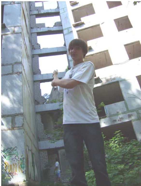
Рис. 4. Обрушение межблочных переходов аварийного дома № 9 (июнь 2012): а) – между 1и 2 подъездами обрушились все конструкции до 2-го этажа; б) – между 3и 4 подъездами еще висят панели бокового ограждения

Выше аварийного дома № 9 в панельных девятиэтажных домах № 13 и № 14 контроль-