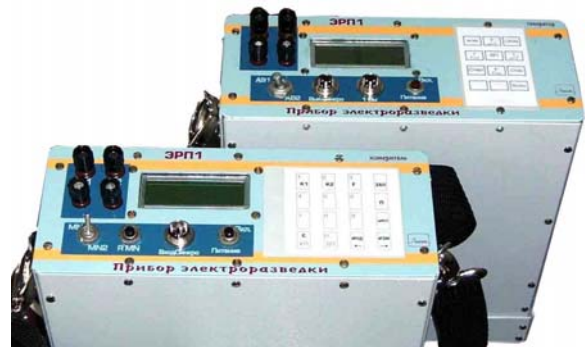
Рис. 5. Внешний вид комплекса ЭРП-1

Днепропетровской облгосадминистрацией в начале 2012 года было выделено 1,1 млн.грн из запланированных 1,6 млн.грн на проведение научно-исследовательских работ и создание «проекта вертикальной планировки жилмассива», а работы поручены Украинскому зональному научно-исследовательскому проектному институту гражданского строительства «КИЕВЗНИИЭП» [9]. В начале мая 2012 сотрудники института начали уточнять реальный УГВ склона с помощью электроизмерительного низкочастотного комплекса для полевых геофизических исследований ЭРП-1 (рис. 5), производимого в Севастополе. Принято решение об устройстве новых 18 режимных скважин на ж/м Тополь-1.