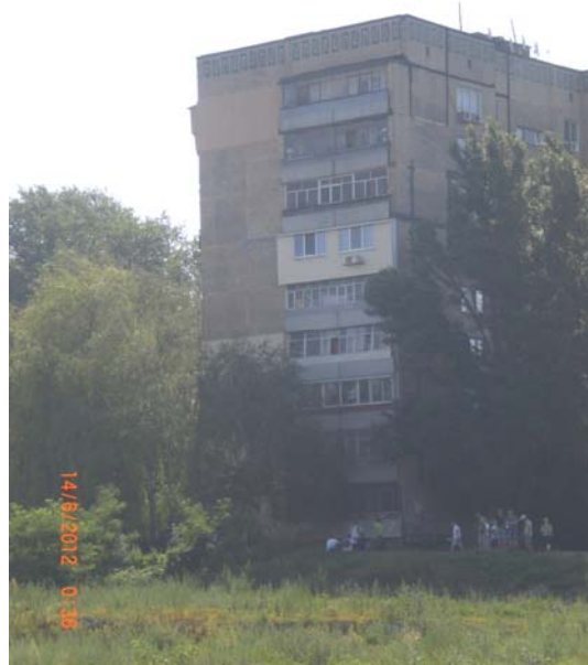
Рис. 3. а) – Боковая стенка цирка оползні у торца дома № 20 в июне 1997 года; б) – засыпанный цирк оползні у торца дома № 20 в июне 2012 года.