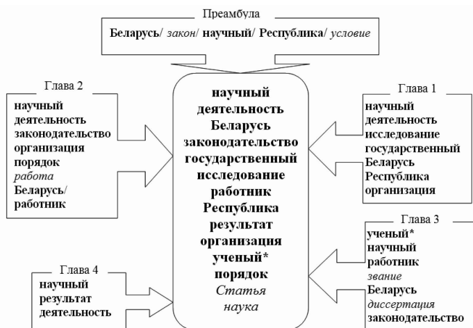
Рис. 2. Сопоставление терминов и дескрипторов Текста 05.