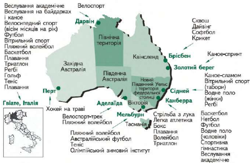
РИСУНОК 1 – Центри підготовки спортсменів Австралії

• забезпечення гнучкої політики розміщення австралійських спортсменів в Олімпійському селищі з метою найбільш ефективної реалізації розробленої схеми тренувального процесу, адаптації до спеки і зміни часових поясів.