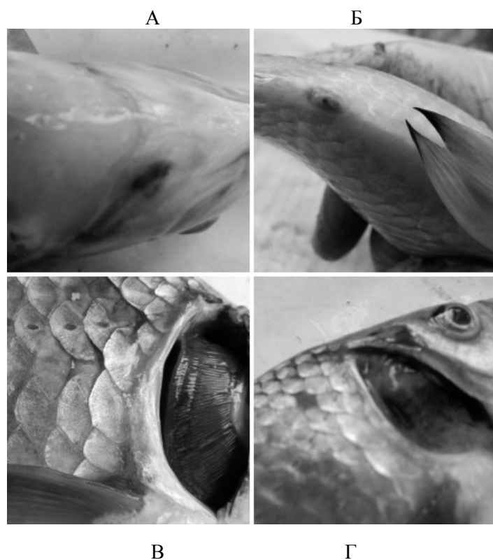
Рис. 2. Стан зовнішніх покривів карася (А – черевна частина тіла, Б – відділ анального отвору) і зябер риб при впливі 0,4 мг/дм 3 гліфосату (Г) та контрольної групи (В)

Карась виявився досить стійким, і при 0,04 мг/дм 3 гліфосату характерних патологічних уражень зовнішніх або внутрішніх органів у нього зафіксовано не було. Зміни, виявлені у карася срібного при 0,4 мг/дм 3 дії гліфосату, представлені на рис. 2-3.