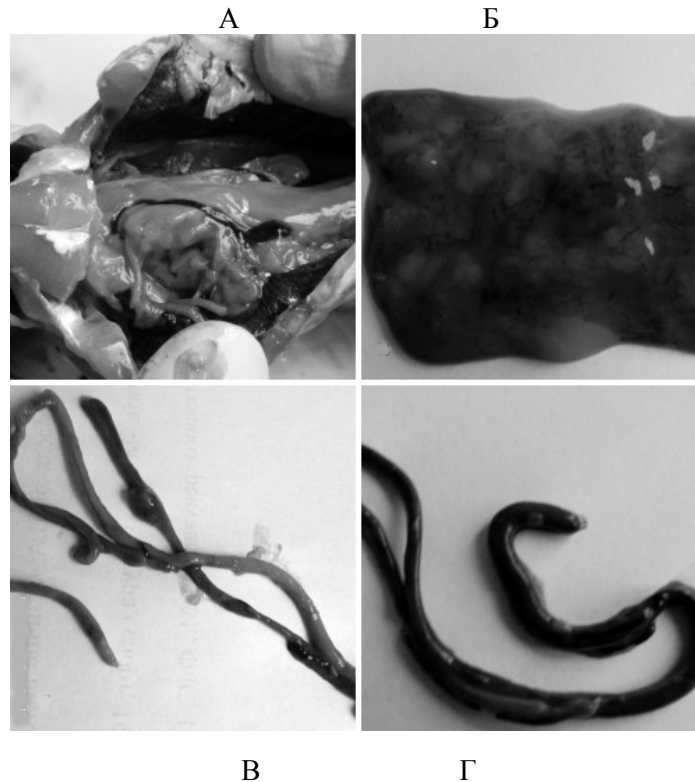
Рис. 3. Стан печінки карася за нормальних умов (А) і при впливі гліфосату (Б), стан кишковика карася за нормальних умов (В) і при впливі гліфосату (Г)

Кишковик, печінка і жовчний міхур карасів, які перебували в умовах дії 0,4 мг/дм 3 гліфосату, також містили ознаки ураження: структура печінки повністю порушена, жовчний міхур був нехарактерного червоного забарвлення, а вміст кишковика – зеленуватого кольору (рис. 3). Варто відмітити, що дана концентрація виявилася летальною для 50 % особин протягом 14-добового експерименту, переважно самців.