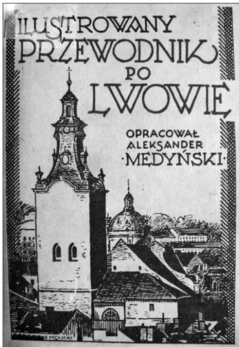
«Ілюстрований путівник Львовом» О. Мединського (1936). Обкладинка худ. Р. Менкіцького