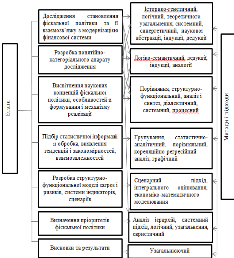
Рис. 1. Етапи та загальнонаукові й спеціальні методи, підходи наукового пізнання дослідження фіскальної політики держави (розробка автора)

Застосування інституціонального підходу до дослідження фіскальної політики та фіскальної системи, надає можливість зосередитись на особливостях взаємодії інститутів між собою та інститутами фінансово-економічної системи, беручи до уваги поведінкові реакції суб'єктів економічних відносин.